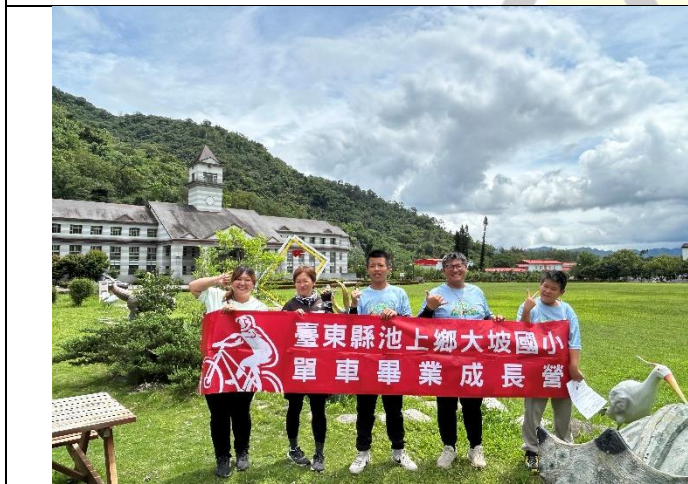
說明：武陵外役監獄