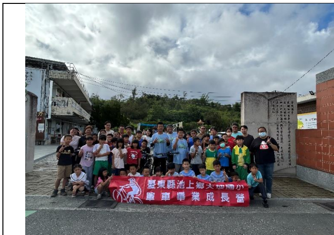
說明：出發前，全校一起為畢業生加油打氣