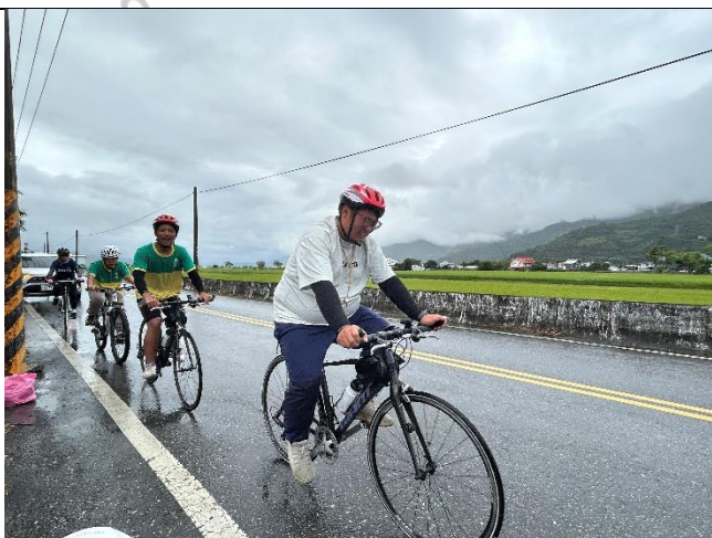
說明：最後一段路下雨了，咬牙撐下去