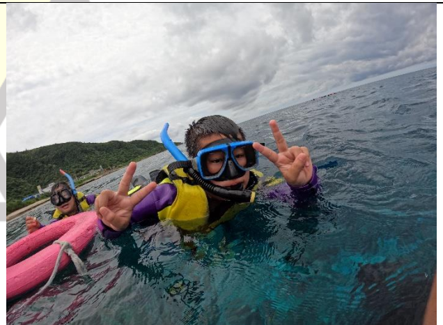
說明：第一次浮潛有點新鮮、有點害怕