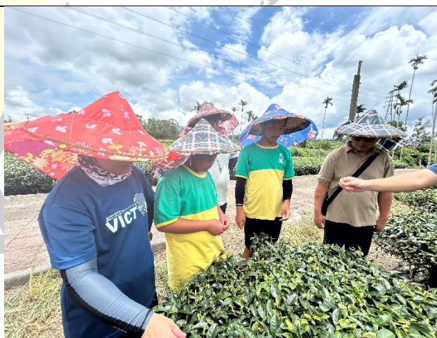
說明：新元昌紅茶產業文化館-採茶體驗