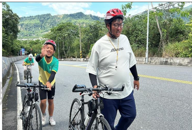
說明：休息是為了走更長的路，我先牽一段