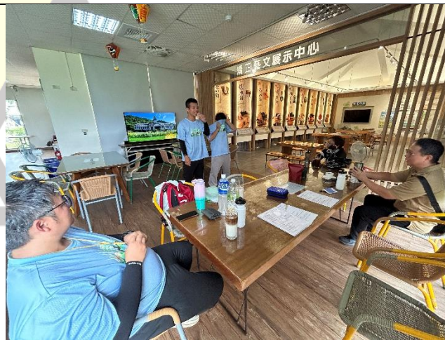
說明：學生出發前做足準備，導覽給師長聽