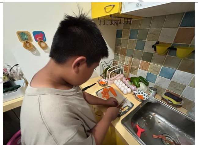
說明：平常都有幫媽媽切菜，難不倒我