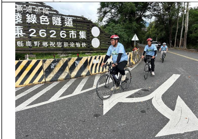
說明：已完成 1/8 的行程，繼續朝台東前進