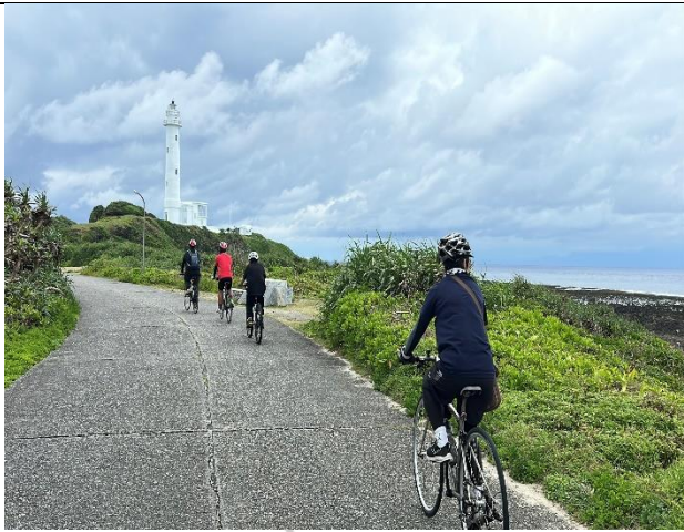
說明：今日目標—綠島燈塔