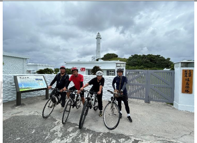
說明：成功抵達綠島燈塔