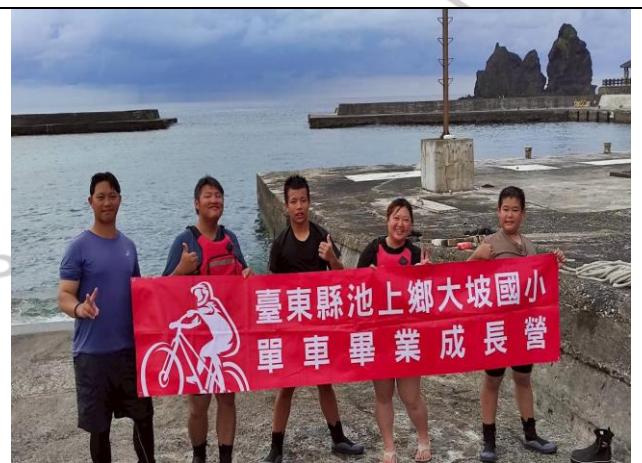
說明：獨木舟體驗課程