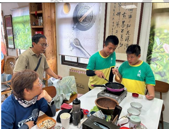
說明：新元昌紅茶產業文化館-炒茶體驗