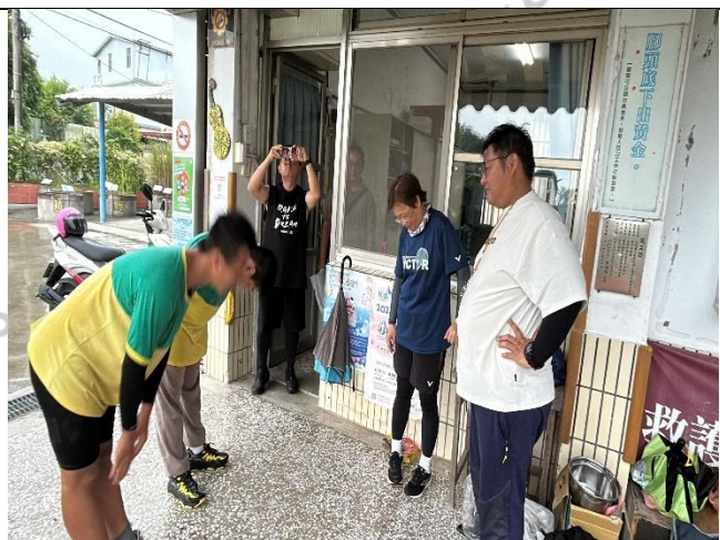
說明：平安抵達，感謝師長一路陪同，完成旅程