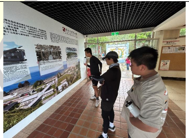
說明：根據學習單尋找有關人權紀念館的知識