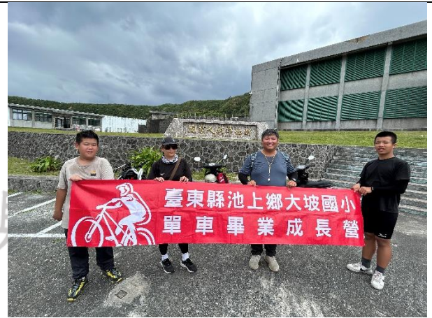
說明：抵達白色恐怖人權紀念館