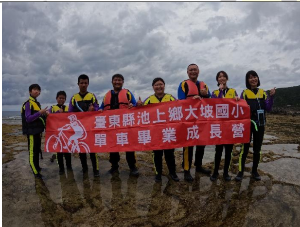
說明：浮潛課程，熱情的觀光客為我們加油打氣