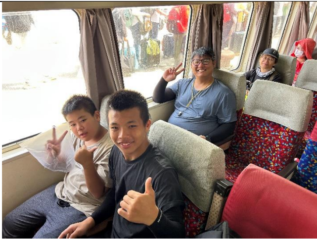
說明：坐船出發去綠島囉