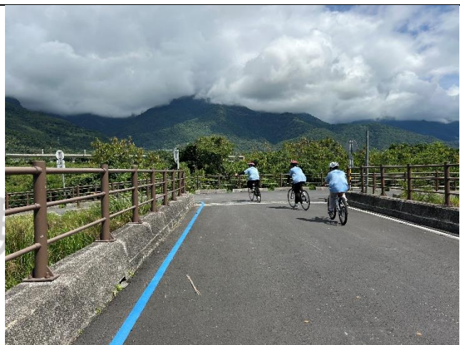
說明：關山自行車道