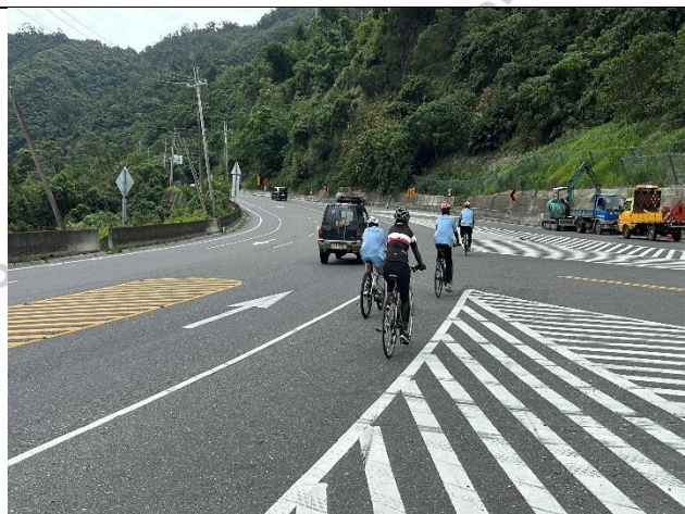
說明：迎來今天的大挑戰-龍過脈