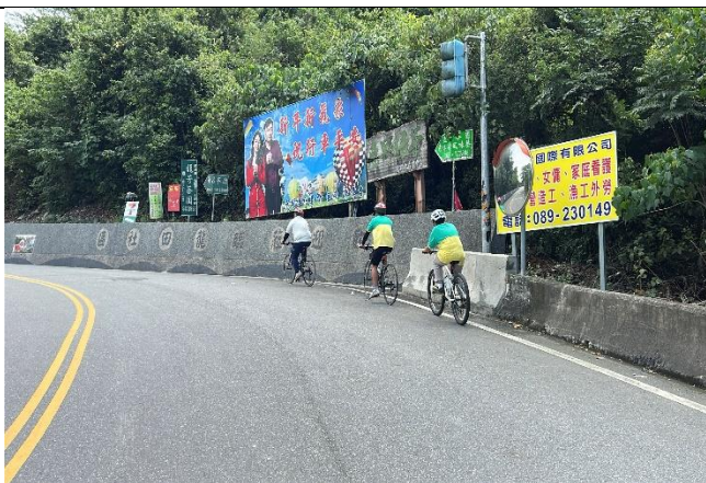
說明：終於要回家了，終極挑戰-大上坡