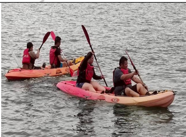
說明：獨木舟體驗課程-老師與學生的競賽