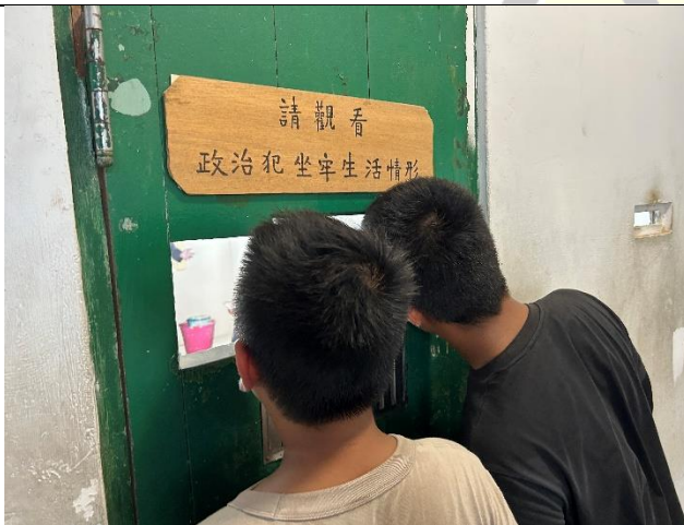
說明：觀察以前政治犯坐牢生活的情形