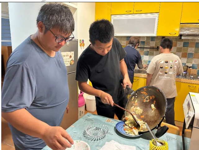
說明：為了展現廚藝，出發前在家苦練許久