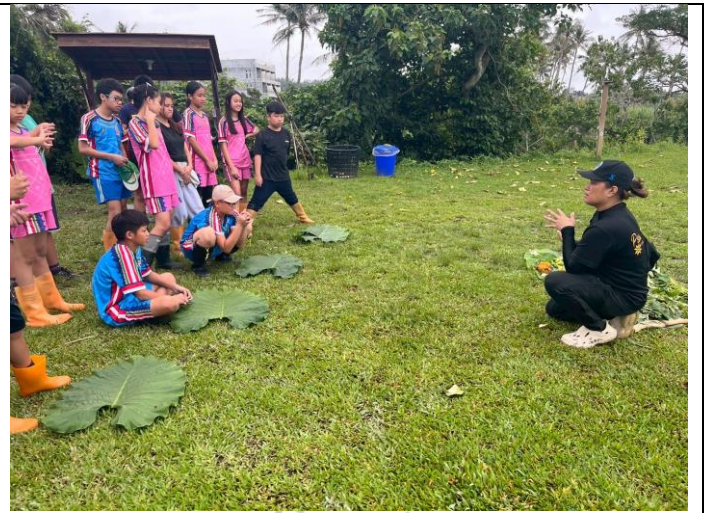
說明：常見野菜辨識說明