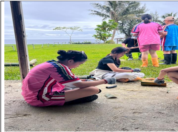
說明：傳統器皿製作