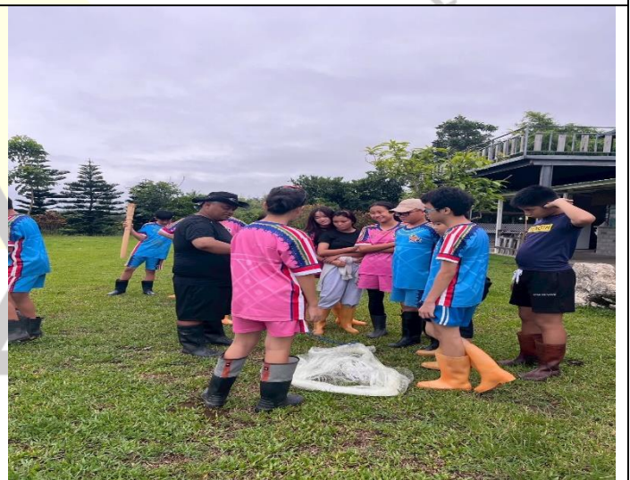
說明：漁網、傳統漁具介紹