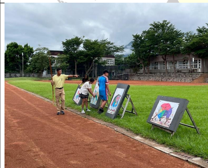
說明：狩獵彈弓體驗