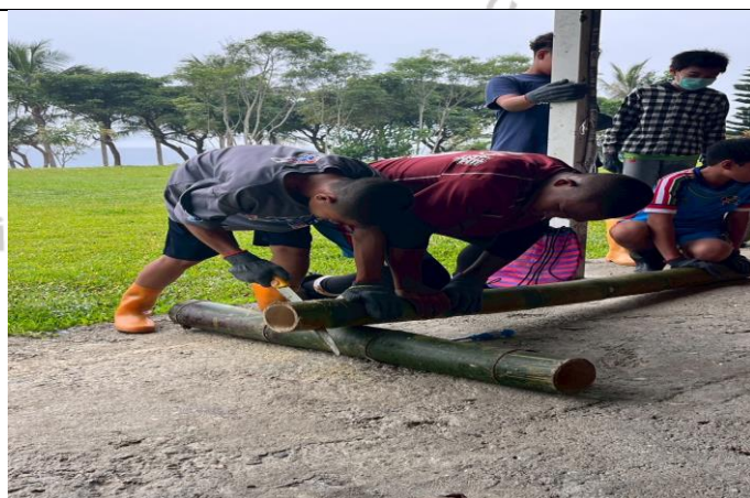
說明：傳統器皿製作