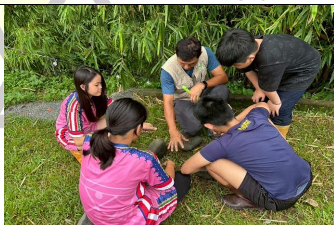
說明：情境體驗、升火實作