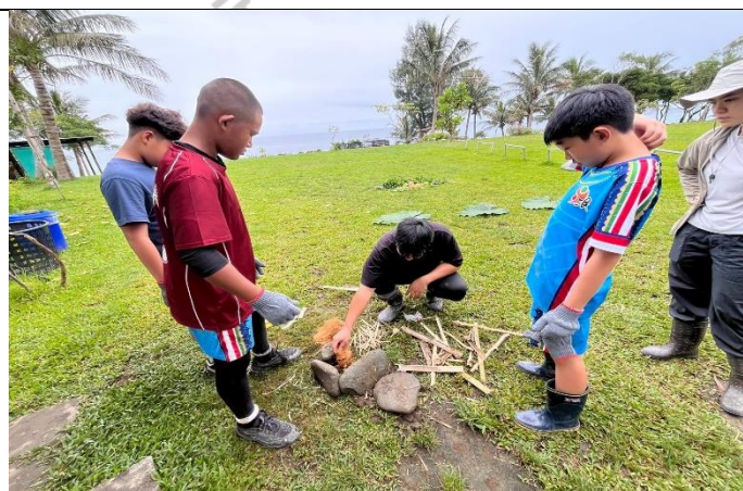
說明：情境體驗、升火實作