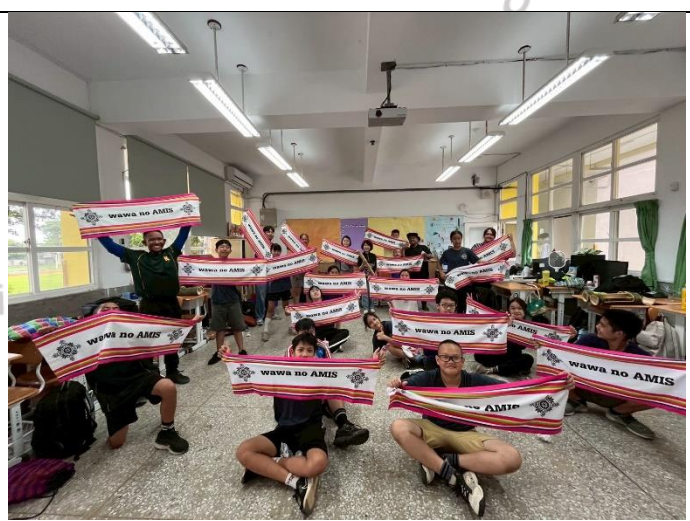
說明：wawa no AMIS