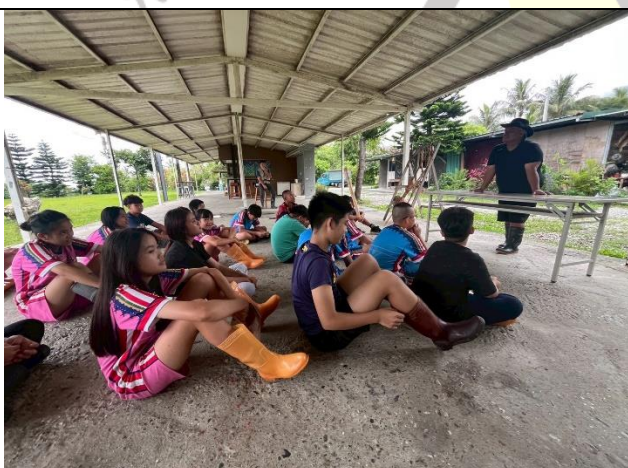
說明：阿美族年齡階級制度價值講述