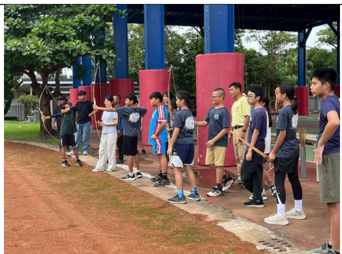
說明：狩獵彈弓體驗