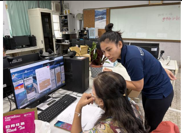
說明：協助學員進行操作。