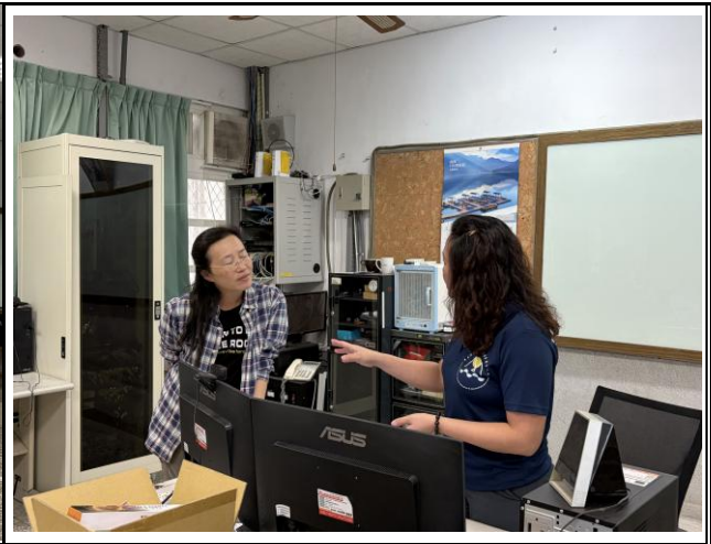
說明：學員於課間與講師進行討論。