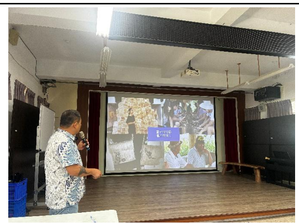
說明：以都蘭國為例，說明文化與海洋的連結。