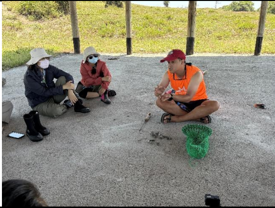
說明：分享下海漁獵故事及經歷。