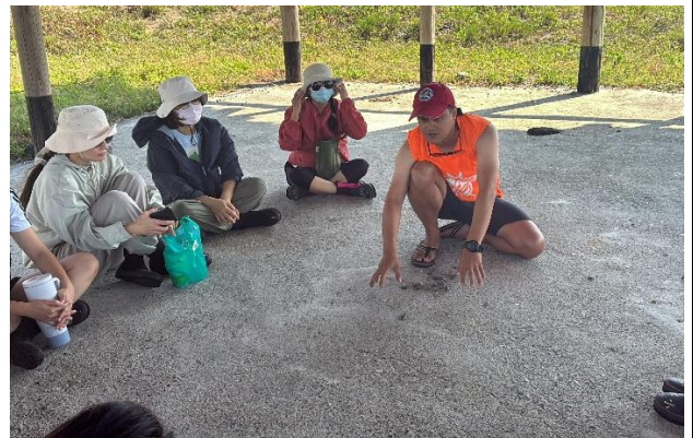
說明：介紹都蘭布部落分級制度及故事。