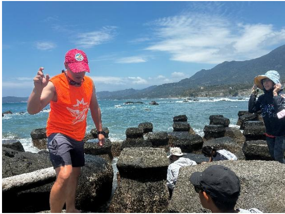
說明：到潮間帶尋找及介紹生物。