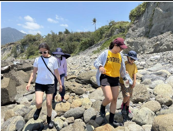
說明：學員於潮間帶石灘移動和觀察