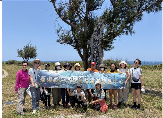
說明：學員與講師合照。