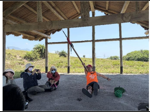
說明：介紹漁獵工具。