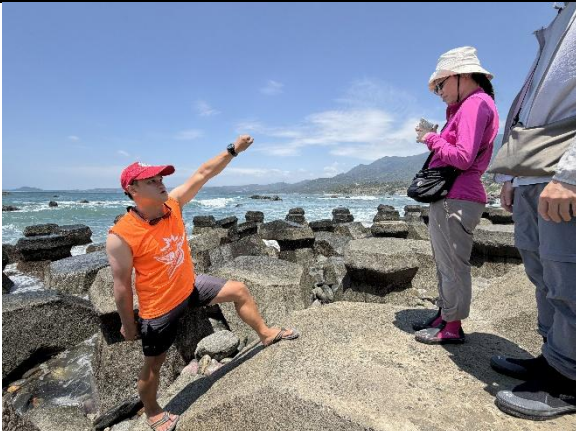
說明：講師分享部落採集習慣。