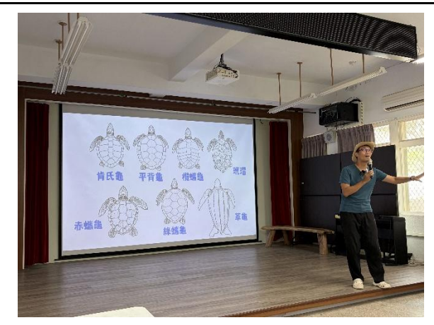
說明：介紹全世界海龜種類。