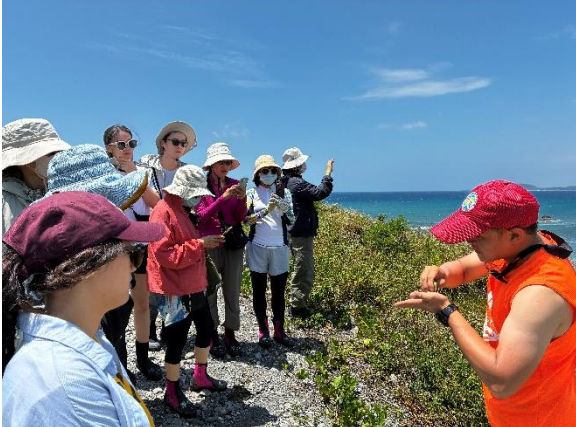
說明：聆聽講師介紹都蘭鼻生態環境。