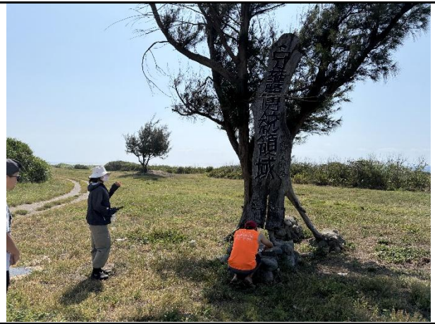
說明：抵達都蘭鼻部落傳統領域。