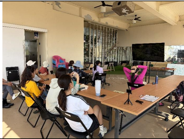
說明：抵達都蘭國，用海祭紀錄影片開場。