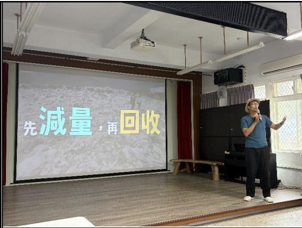
說明：倡導垃圾先減量再回收。