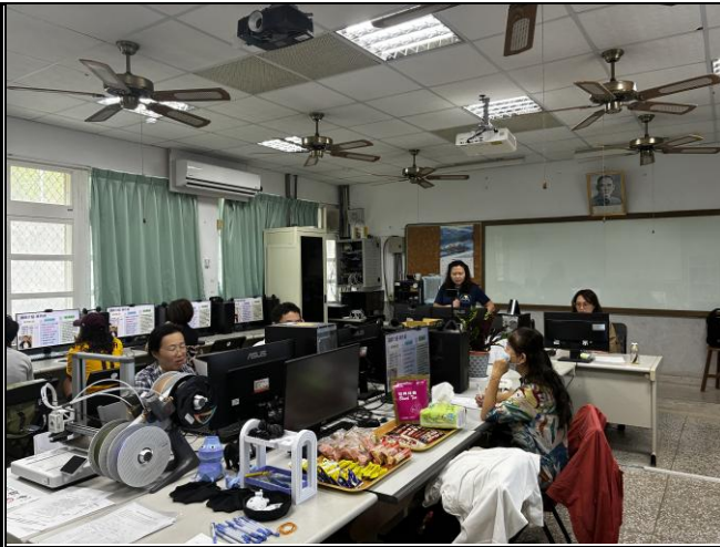
說明：AI 輔助海洋教育體驗課程設計課程開始。