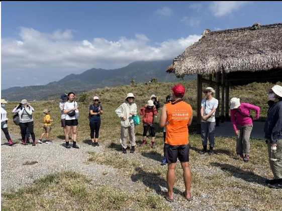
說明：親近部落海洋領域。