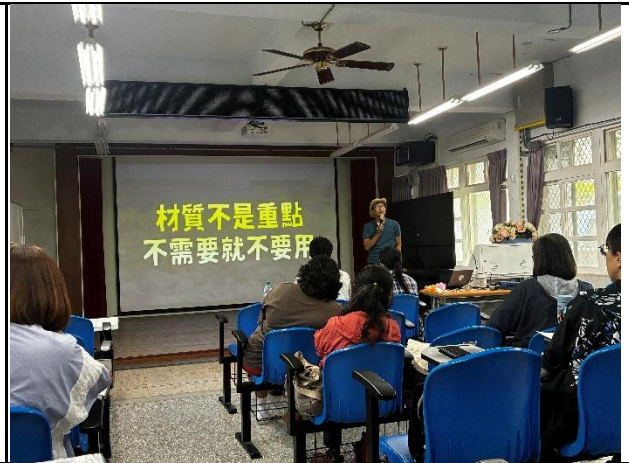
說明：提醒大家不要浪費資源。