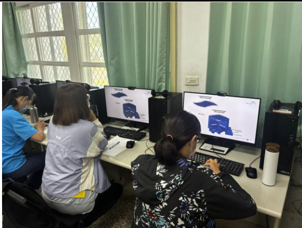
說明：介紹 AI 輔助工具。