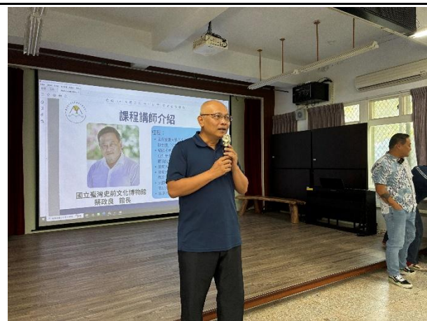
說明：中心召集人開場。