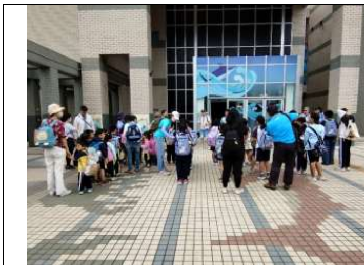
說明：到達水族生態研究所