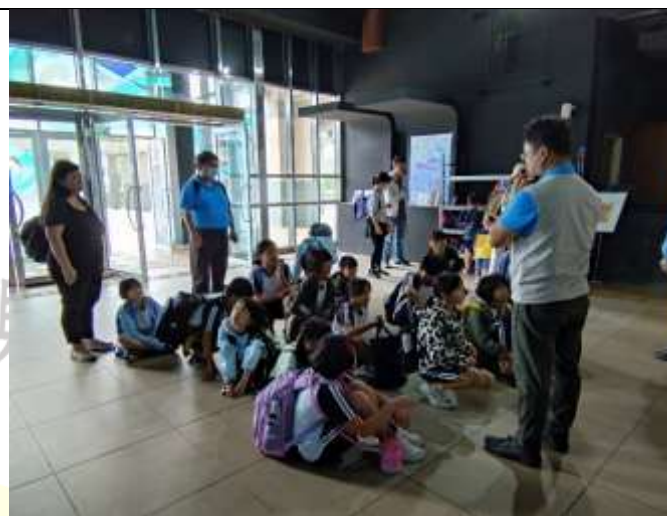
說明：分組導覽說明