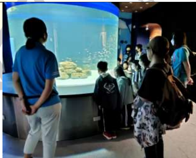
說明：參觀水族館活動