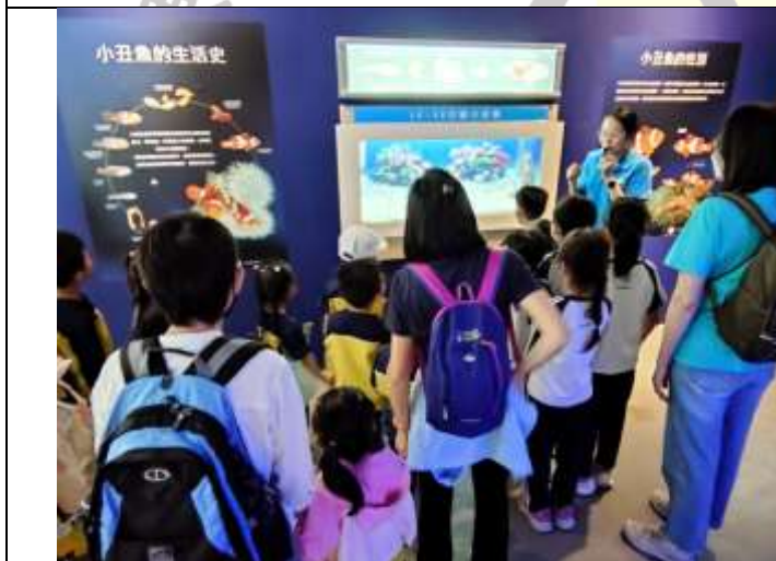
說明：分組導覽進行