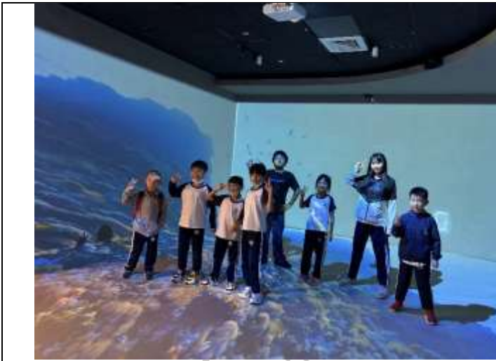
說明：管區內有互動遊戲，學生玩得不亦樂乎。