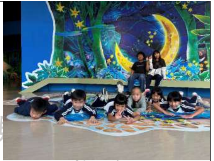
說明：場館空間非常友善，學生都到處躺臥。