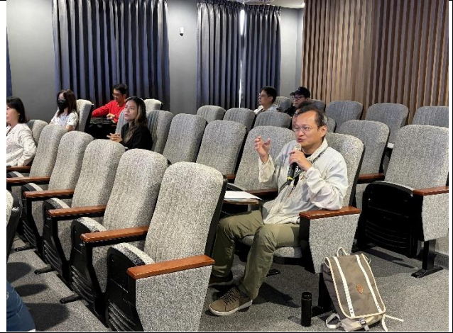
說明：學員進行課程內容的回應。