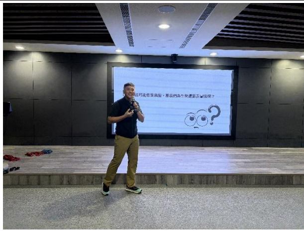
說明：講師向學員建立風險意識。