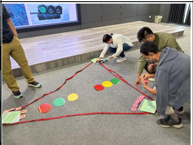
說明：利用風險紅綠燈進行檢視。