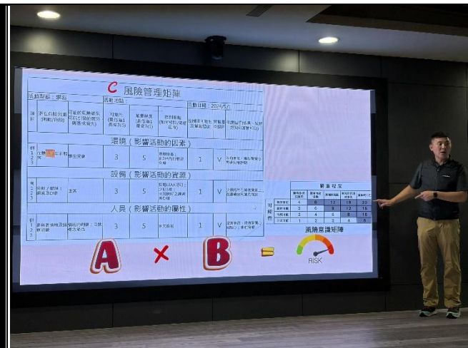
說明：講師說明風險管理矩陣。