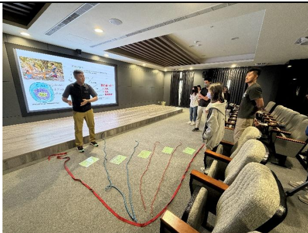
說明：風險與能力德的評估。