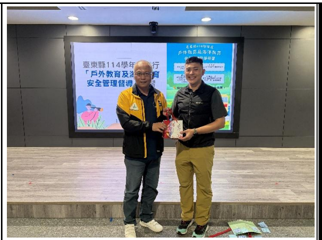
說明：中心召集人贈與禮品感謝講師的精采課程。