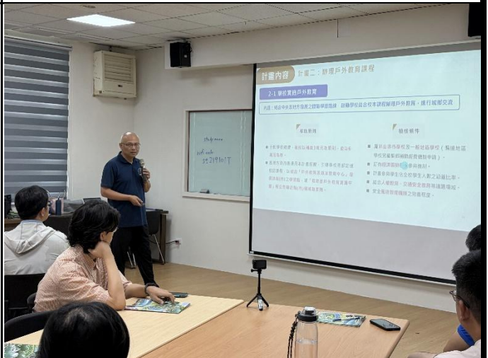
說明：計畫申請說明。