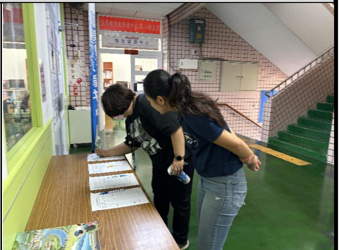
說明：與會師長簽到。