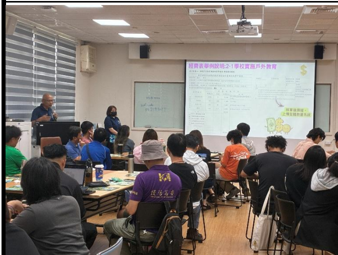
說明：計畫經費表說明。