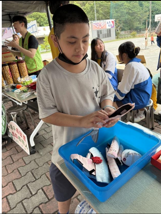
說明：進行虱目魚食用部位組裝。