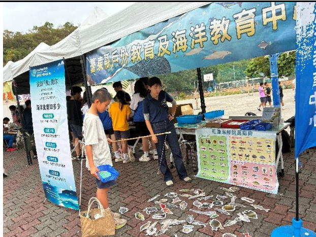
說明：透過釣魚遊戲認識魚種。