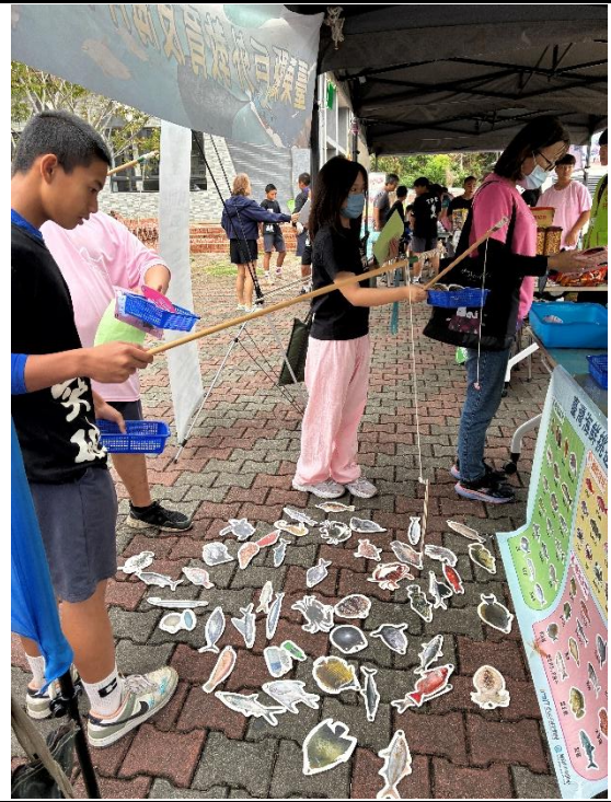
說明：透過釣魚遊戲認識魚種。