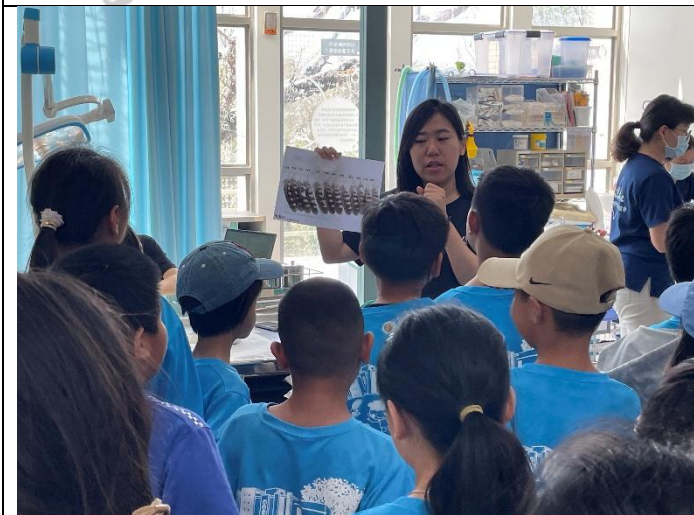
說明：死亡動物的羽毛可以幫助受傷動物