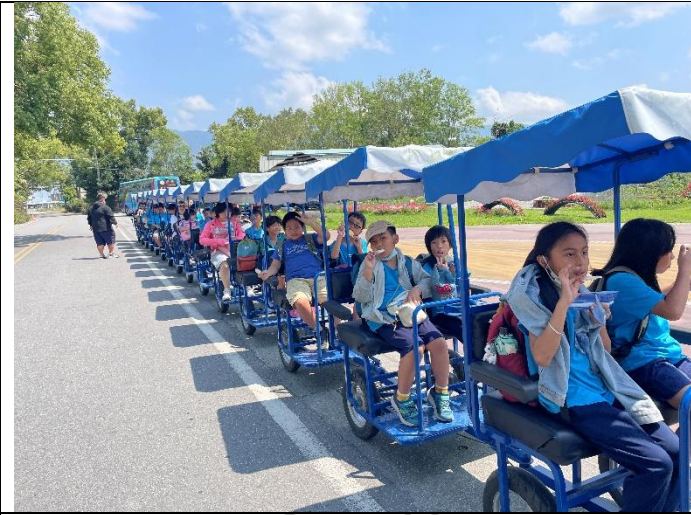
說明：乘坐拉拉車聆聽導覽介紹池上