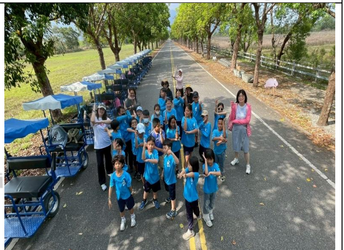
說明：感受綠意盎然的茄苳大道