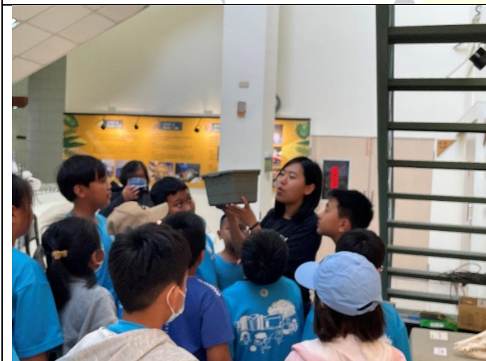
說明：遇到受傷的動物應如何安置