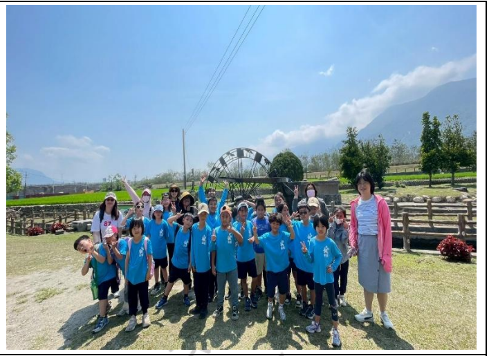
說明：早期水車將河川水引入灌溉溝渠