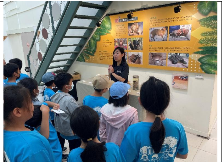
說明：介紹動物受傷常見的原因