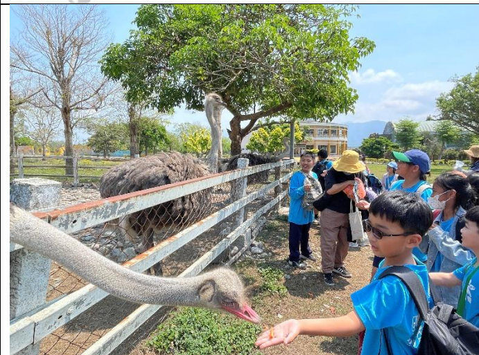
說明：令人又喜歡又害怕的駝鳥餵食。