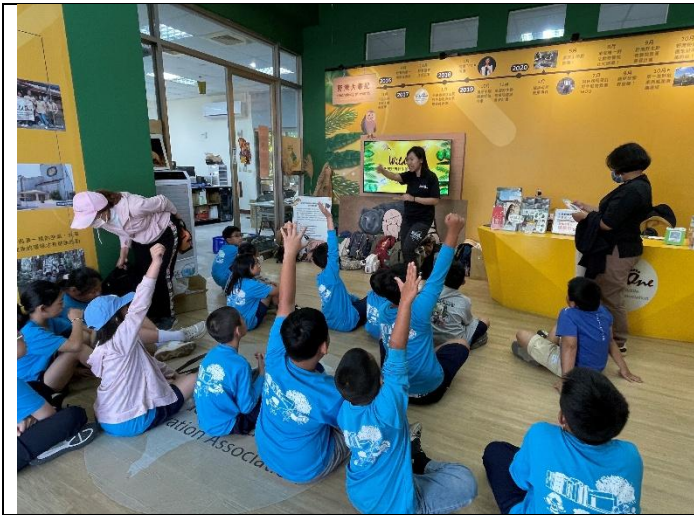
說明：認識野灣動物醫院的歷史