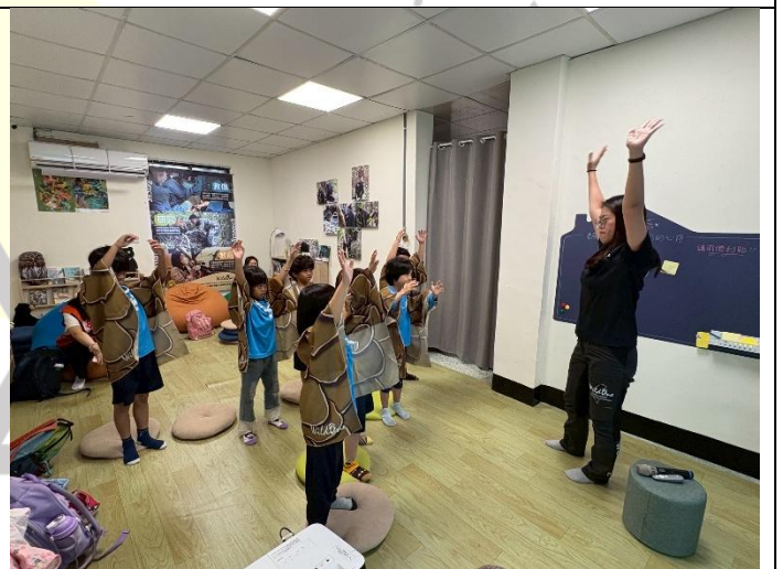
說明：伸伸小手學習穿山甲挖土的樣子