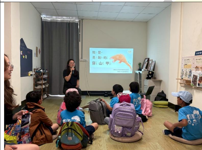
說明：一起閱讀我是穿山甲繪本