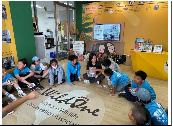
說明：救助動物的故事並發表今日收穫