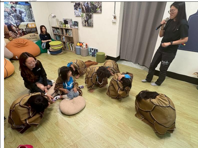
說明：遇到危險了趕快把身體捲起來