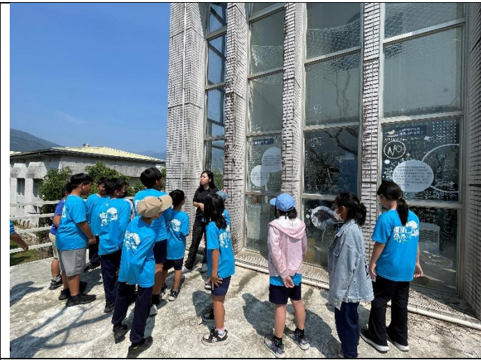
說明：野放前要先在這裡適應野生環境