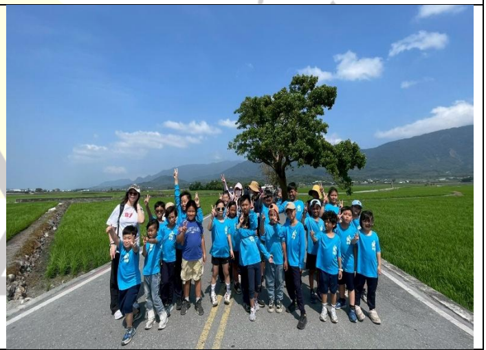
說明：暢遊伯朗大道感受農田風光