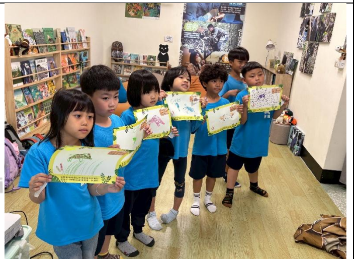
說明：說說看今天我的小發現