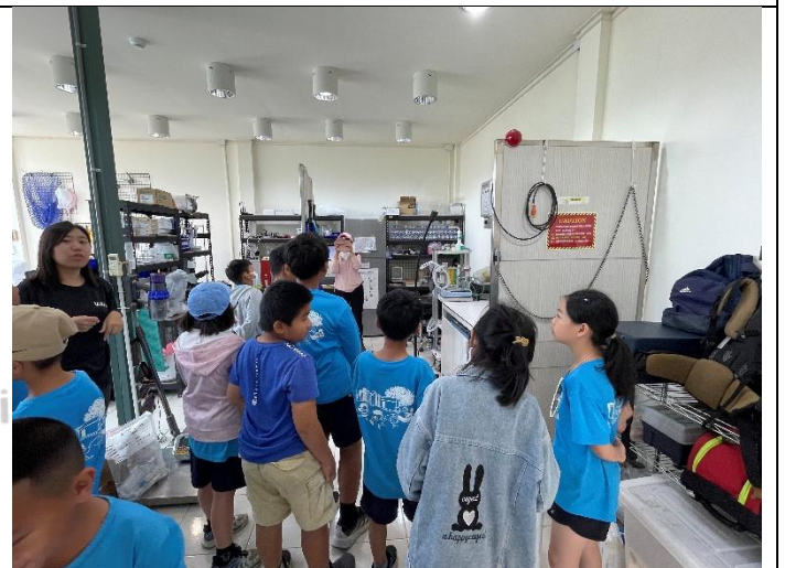
說明：參觀暫時安置動物的病房