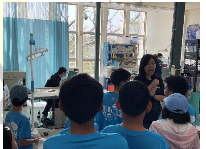
說明：介紹動物醫院手術室