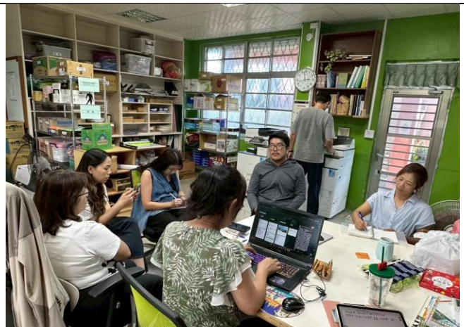
說明：教學團隊工作分配