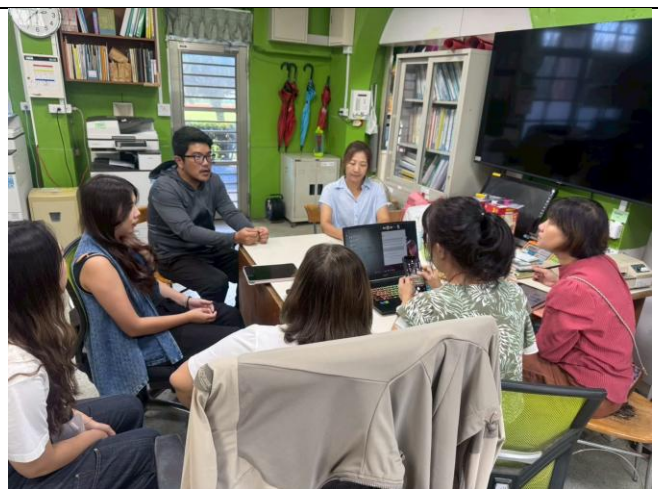
說明：農友提出對於友善耕作的見解