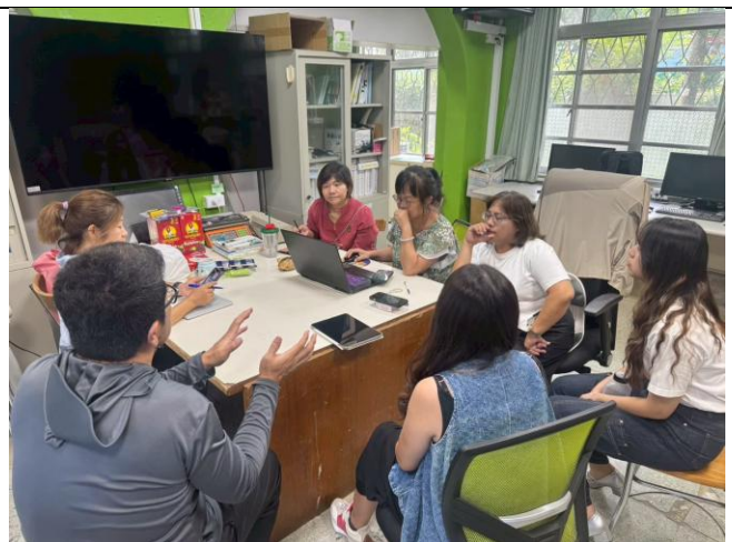
說明：架構訪談架構