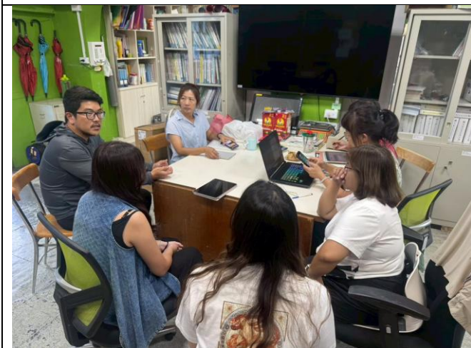
說明：提出學生訪談面向