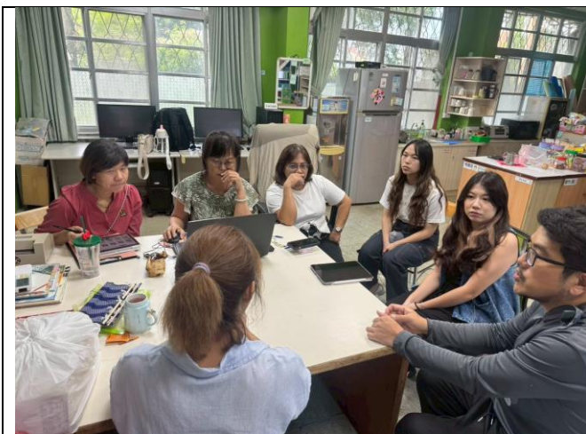
說明：與在地農友討論