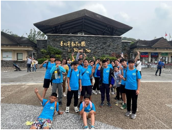
說明：抵達臺北市動物園，生態與動物探索體驗