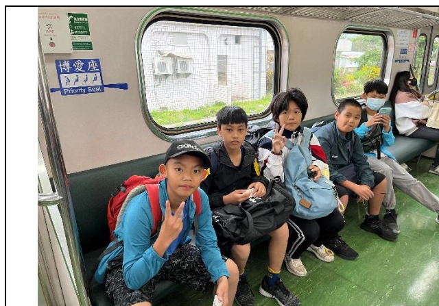
說明：台鐵瑞源站準備出發，行前重要事項提醒