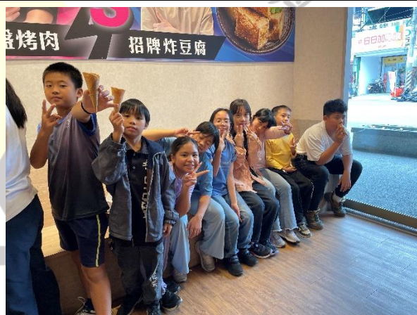
說明：抵達用餐地點，享用個人小火鍋