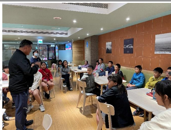
說明：抵達住宿地點，校長提醒重要事項與勉勵