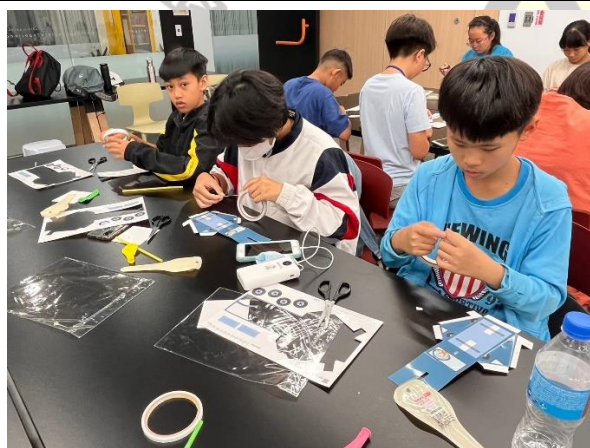
說明：抵達國立臺灣科學教育館，動手做科學