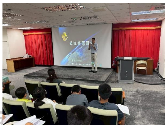
說明：10月16日參訪中央大學遙測中心