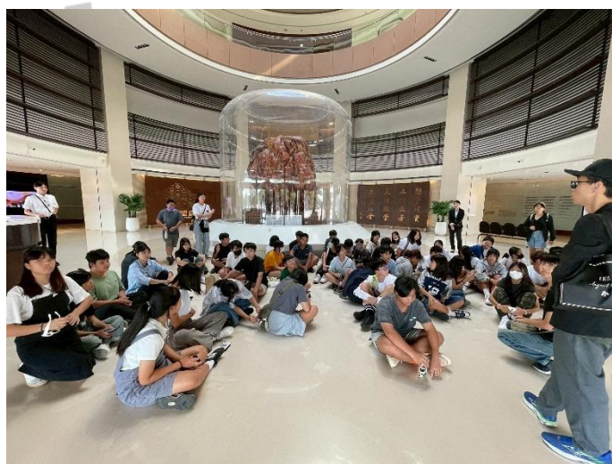
說明：10月16日參觀台塑文物館