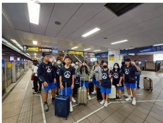
說明：10 月 15 日台北捷運站巡禮