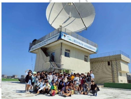
說明：10月16日參觀中央大學雷達站