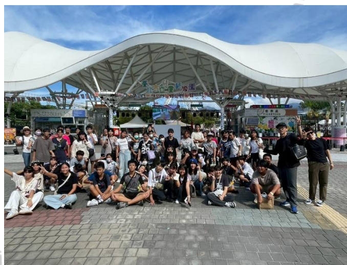
說明：10月17日台北市立兒童遊樂園