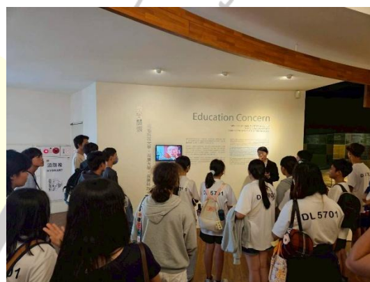
說明：10月16日台塑文物館解說