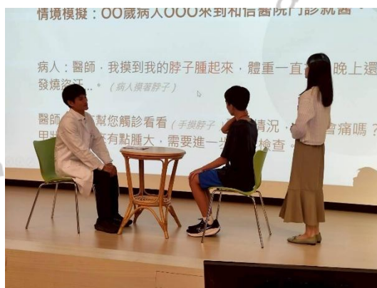
說明：10 月 15 日和信醫院模擬看診