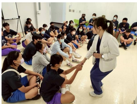
說明：10月15日和信醫院臨床實習體驗