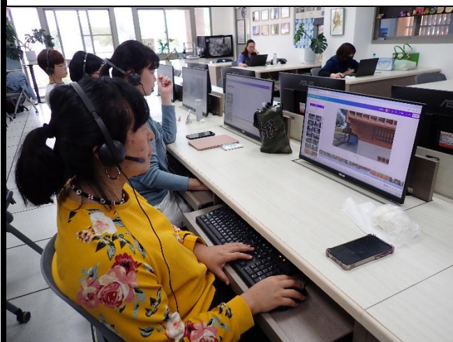
說明:回到教室進行剪輯教學及操作。