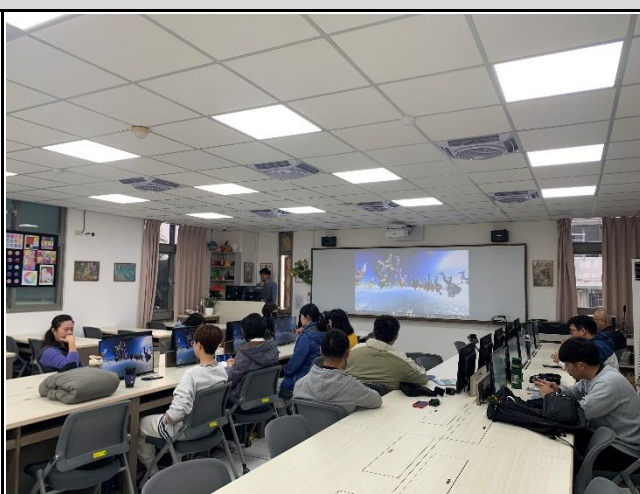
說明：講師介紹 Gopro 攝影特性。