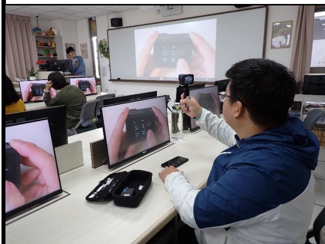
說明：熟悉器材使用方法。