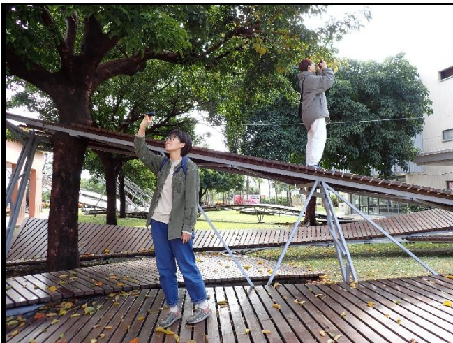
說明:收集素材，思考腳本。