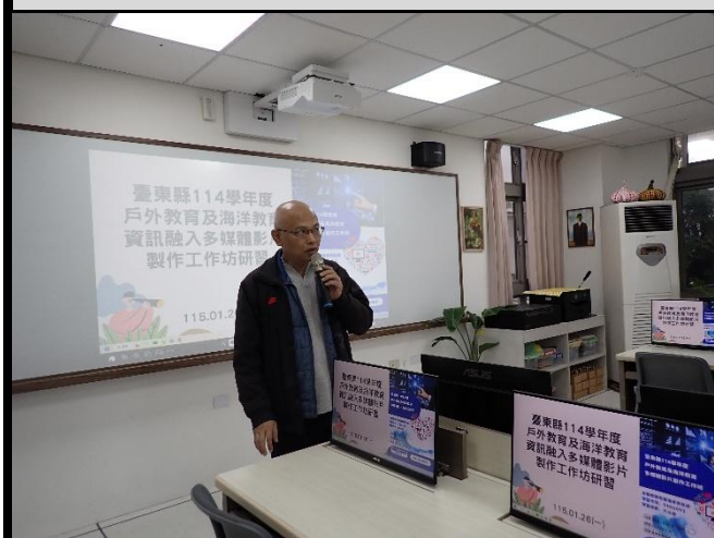
說明：中心召集人致詞開場。