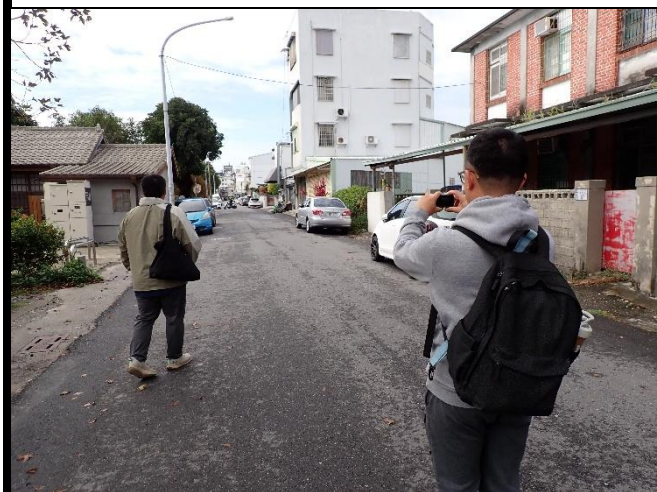
說明：學員進行影片素材收集。