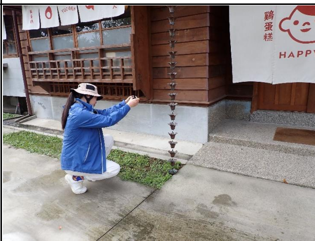
說明：學員投入影片素材收集。