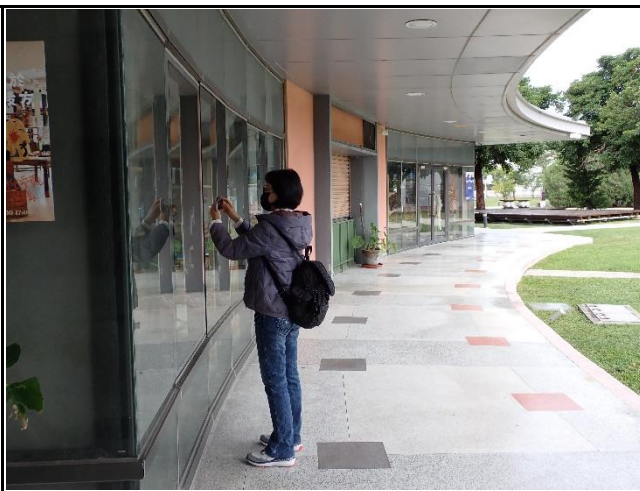
說明:從各自的視角拍攝素材。