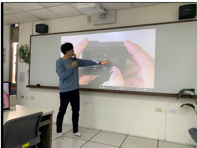
說明：講師進行 GoPro 設備操作介紹。