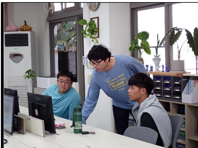
說明：講師示範操作給學員