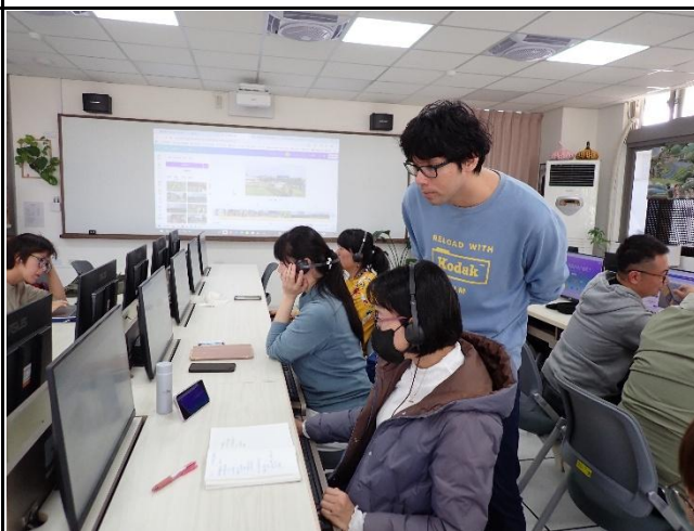
說明: 講師隨時了解學員操作狀況。