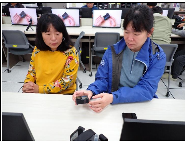
說明：學員實際操作。