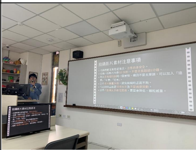
說明：講師說明構圖及拍攝注意事項。