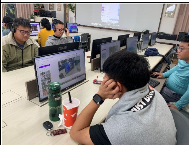
說明: 有合作共編也有獨立創作。