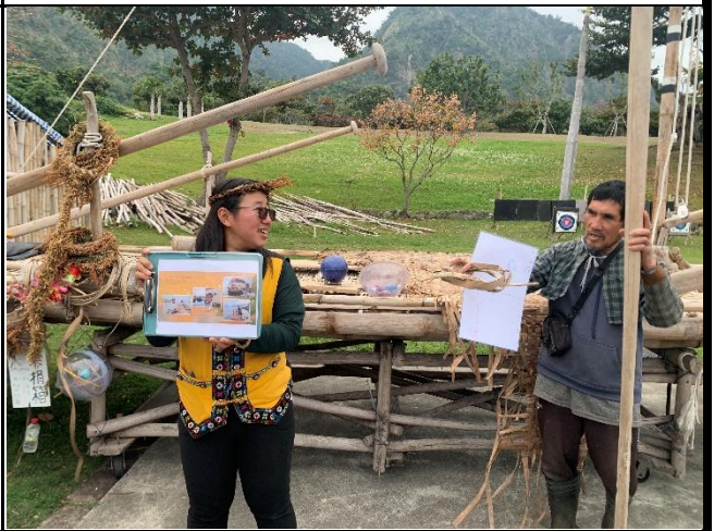
說明：部落耆老分享經驗。