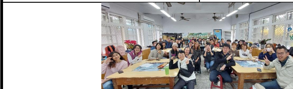
說明：上午海洋詩創作課程結束後合影。