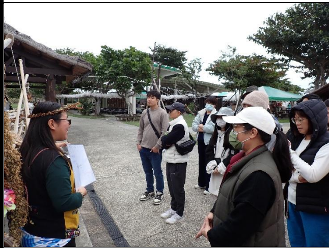
說明：介紹阿美竹筏 Sanayasay 成長與歷程。