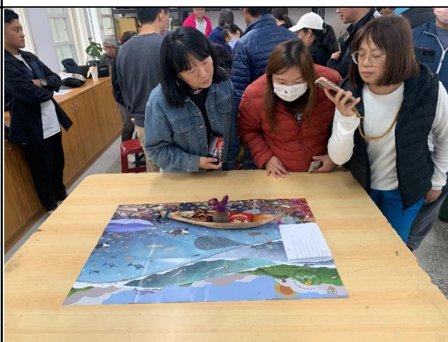
說明：互相欣賞各組作品。