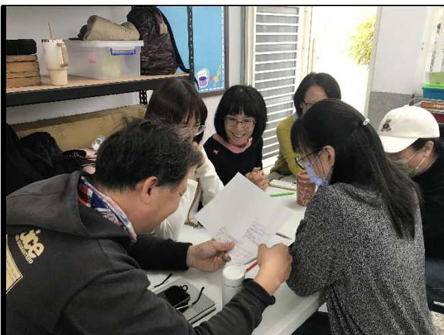
說明：學員互享討論激盪出靈感。