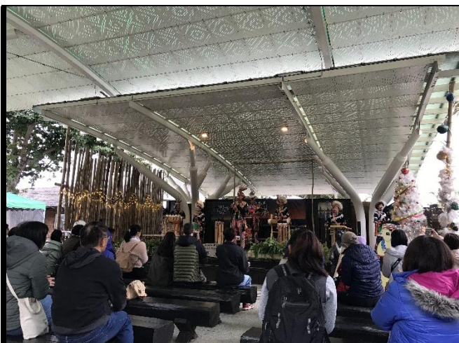
說明：欣賞 Amis 沓互樂團表演。