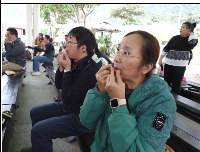
說明：完成後學習吹奏。