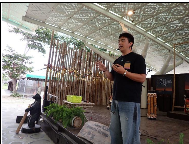
說明：進行手作課程-竹笛。