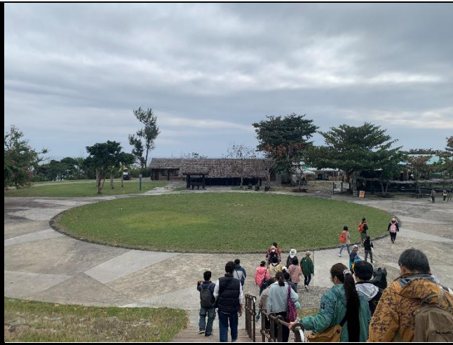
說明：移動至阿美民俗中心。