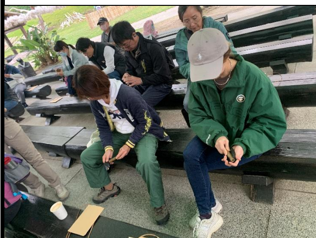
說明：用砂紙磨竹笛使其外觀平整。