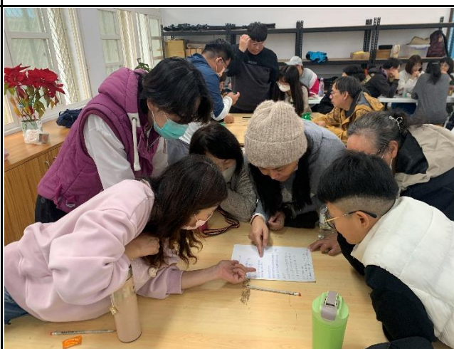
說明：學員投入創作。