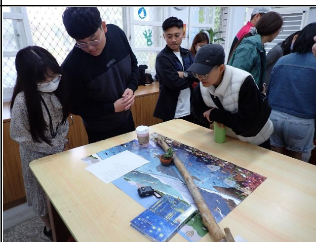
說明：互相欣賞各組作品。