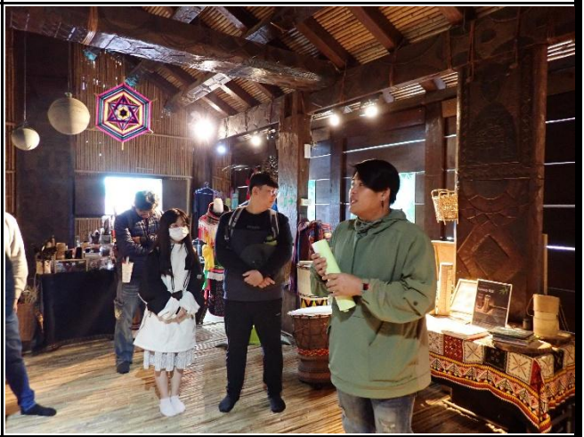
說明：講師進行南島樂器講解。