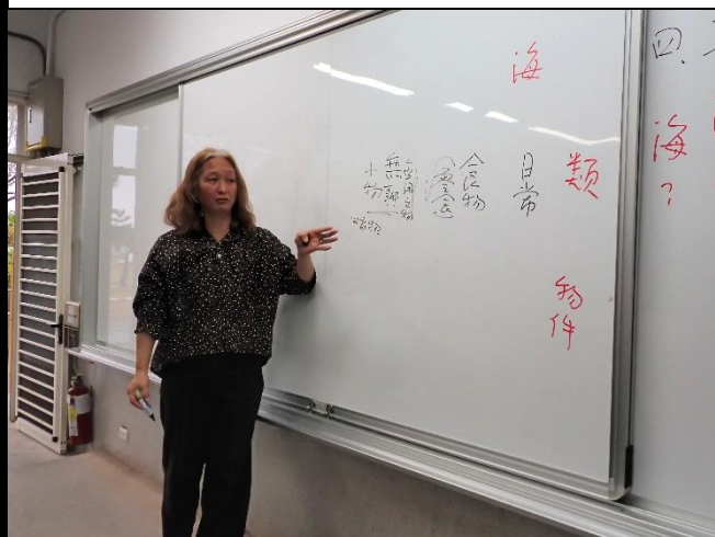
說明：講師進行創作引導。