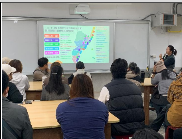
說明：中心副召集人介紹中心。