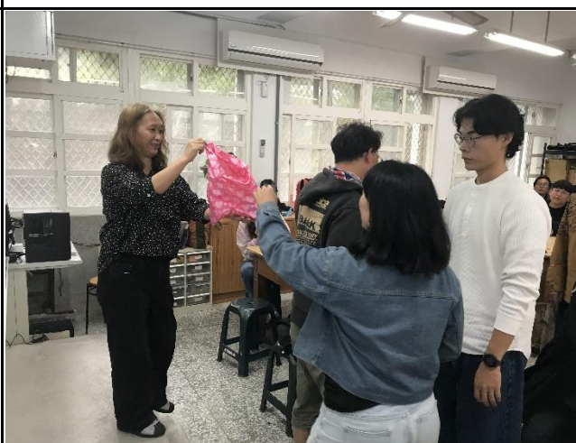
說明：學員上來抽取創作素材。