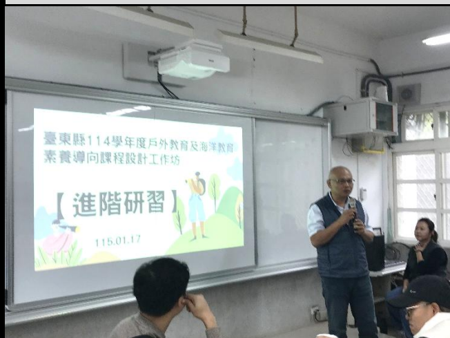
說明：中心召集人致詞開場。