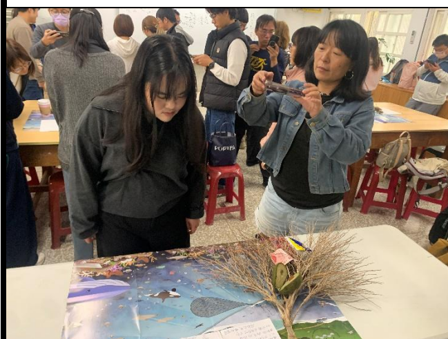
說明：互相欣賞各組作品。