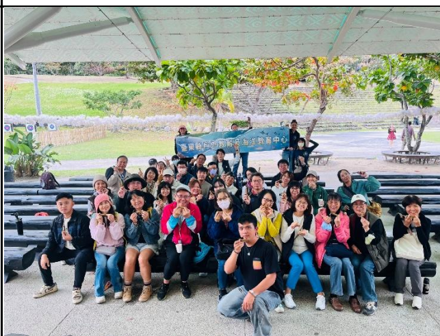
說明：課程結束後合影。