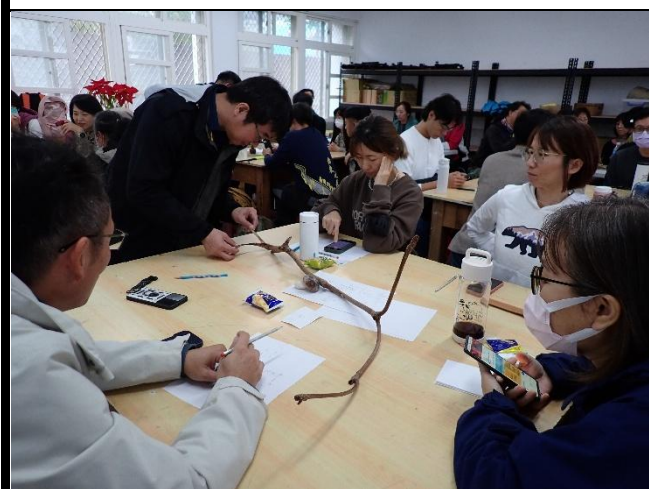
說明：觀察素材，思考靈感。