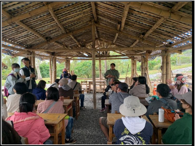
說明：講師於竹屋進行課程流程說明。