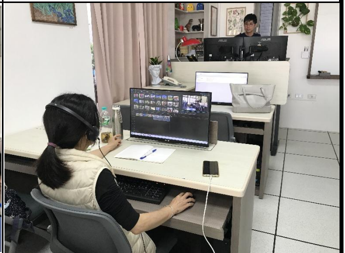
說明：威力導演影片剪輯實作。