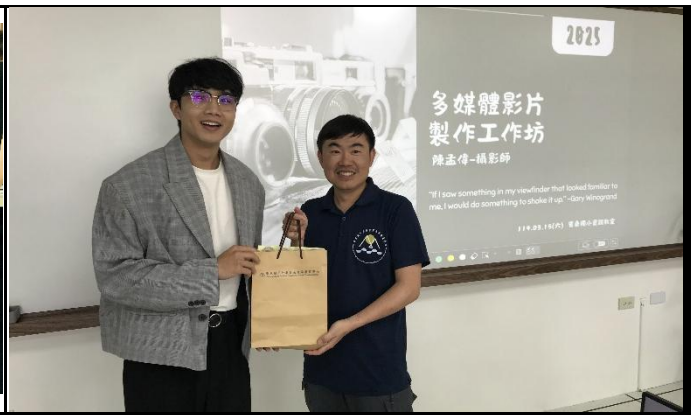
說明：致贈講師禮品