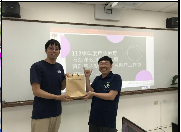
說明：致贈講師禮品。