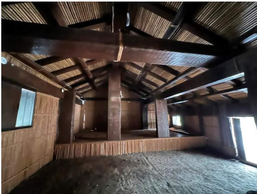
♪阿美族傳統家屋&建造家屋參考影片：

https://www.youtube.com/watch?v=0UmIpJd6Wm0&t=16s