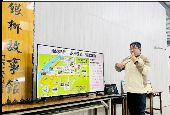
說明：介紹銀柳產業與地方的結合。