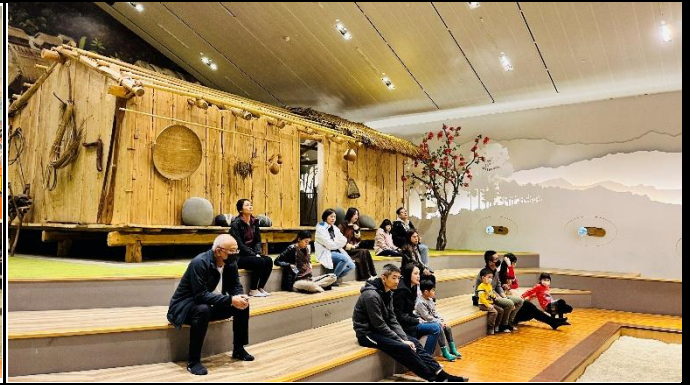
說明：參訪蘭陽博物館。