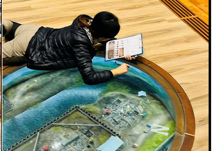
說明：了解考古現場工作。