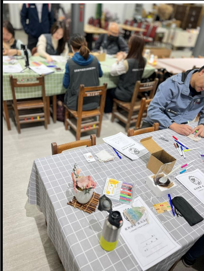
說明：進行銀柳碳香包製作。