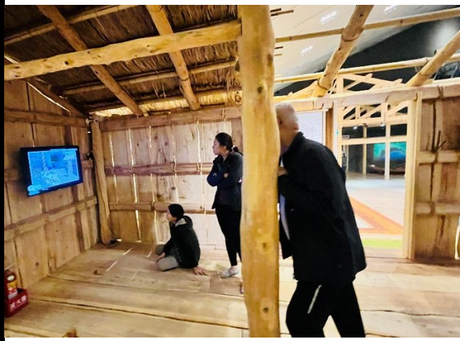
說明：欣賞家屋建造過程紀錄。