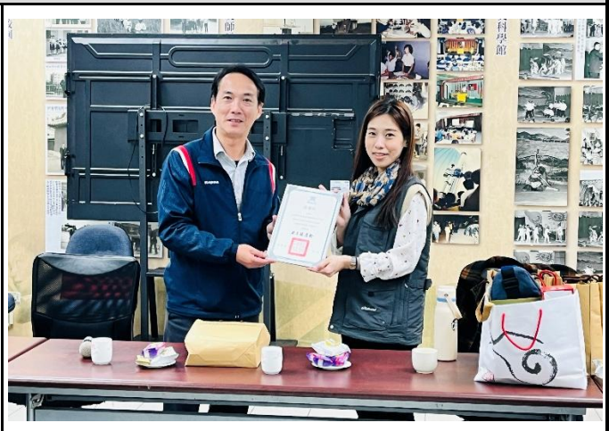
說明：由科長致贈感謝狀，並互贈禮品。