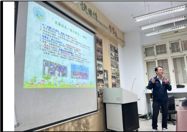
說明：由宜蘭戶海中心召集人分享中心運作狀態。