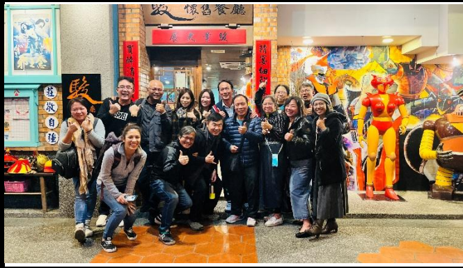
說明：與宜蘭戶海團隊大合照