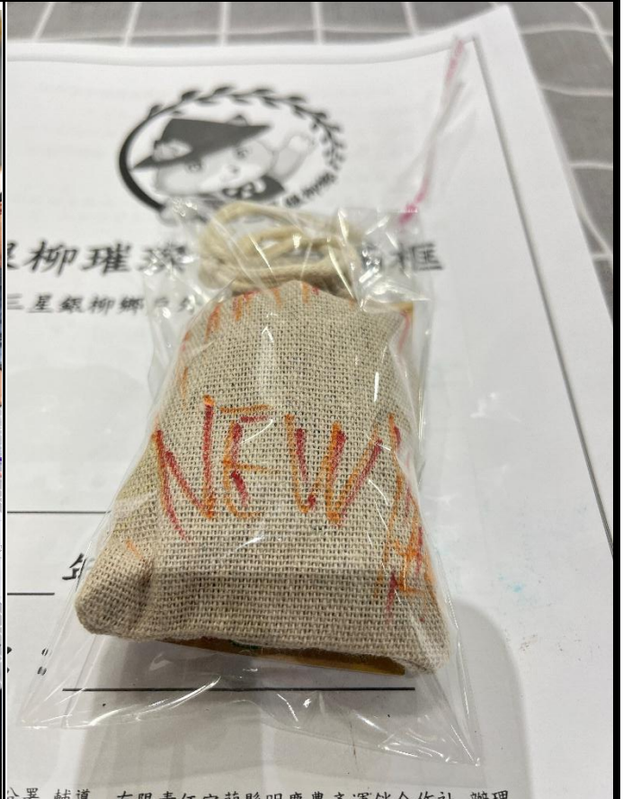
分署 輔導 有限責任宜蘭縣明慶農產運銷合作社 辦理