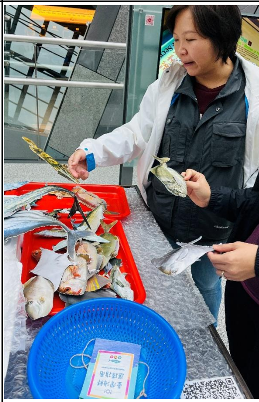
說明：食魚教材觀摩。