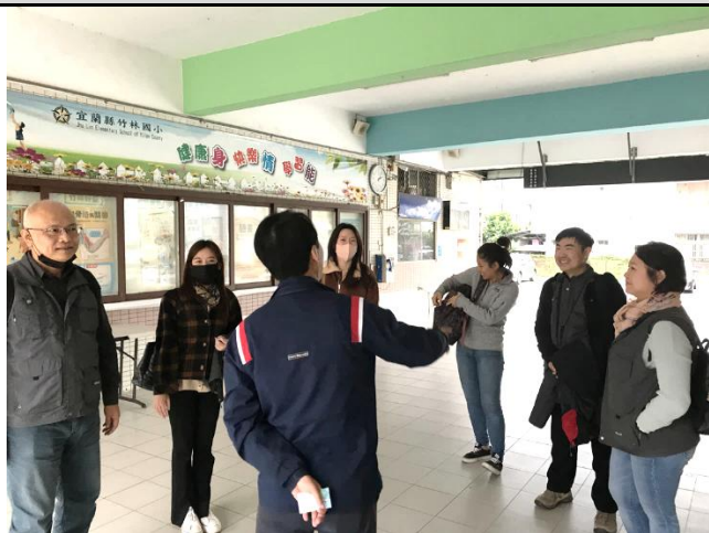
說明：抵達宜蘭戶海中心。