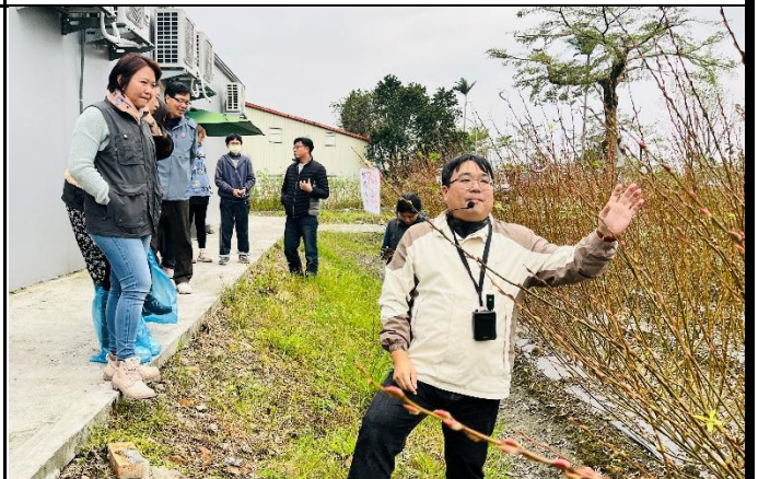
說明：實地到銀柳田。