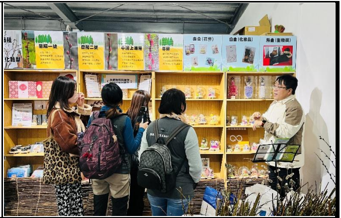
說明：至三星銀柳故事館參訪。