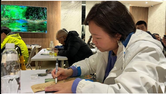
說明：課程計畫反思