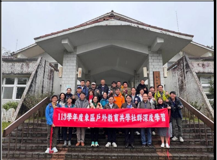
說明：福山植物園行政中心前合影