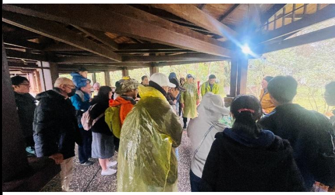
說明：介紹福山植物園