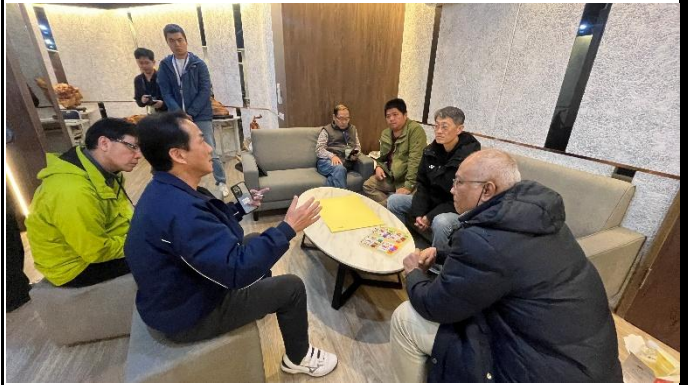
說明：行政規劃議題討論