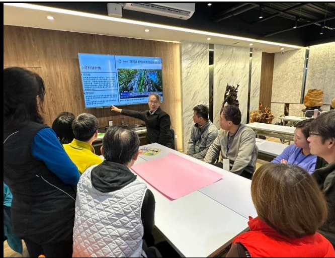
說明：課程內容討論