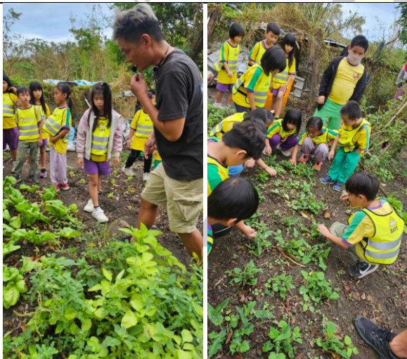
說明：參觀阿嬤的菜園