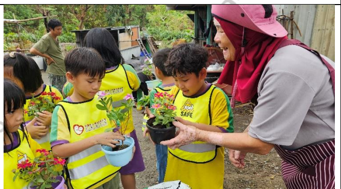
說明：製作自己獨一無二的盆栽