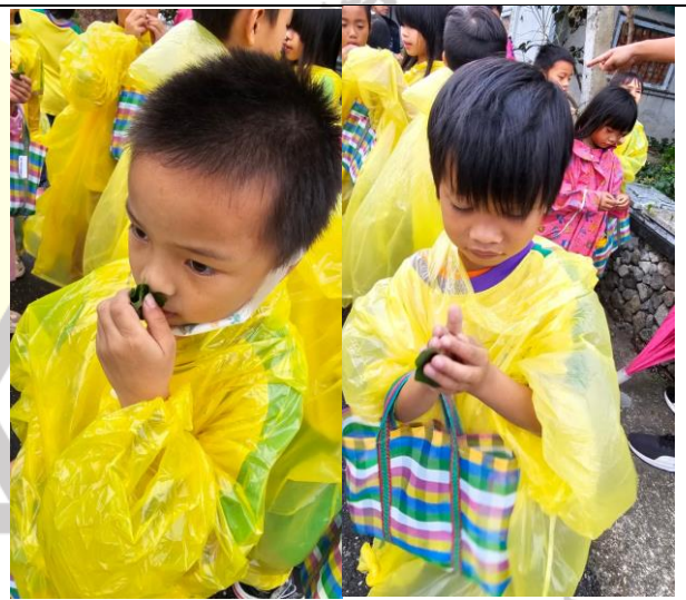
說明：學生五感觀察野菜