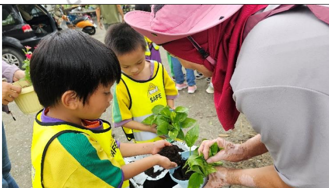
說明：把想要的花草移到盆子裡