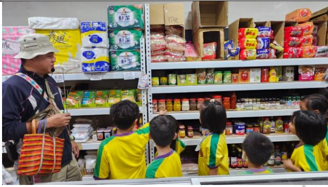
說明：社區雜貨店介紹原住民醃漬食物