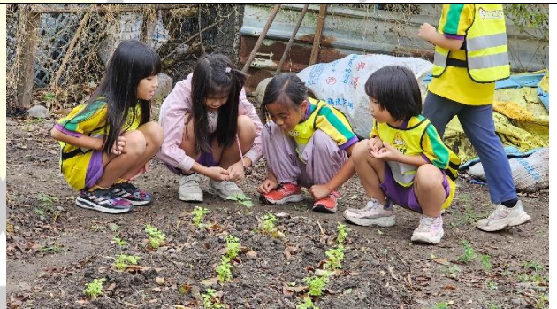
說明：觀察阿嬤種的菜