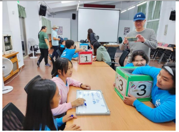
說明:森林動物觀察線