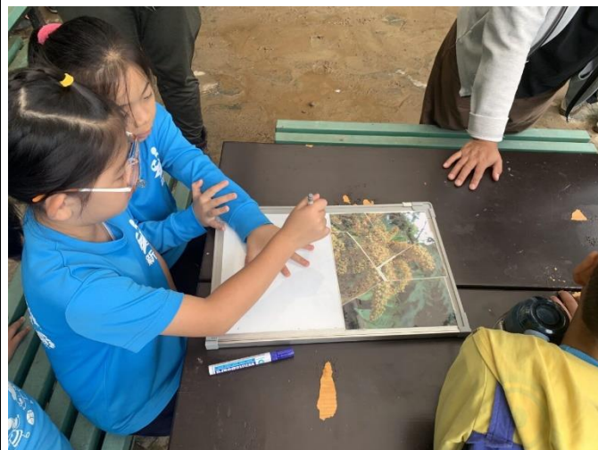
說明: 植物拼圖操作