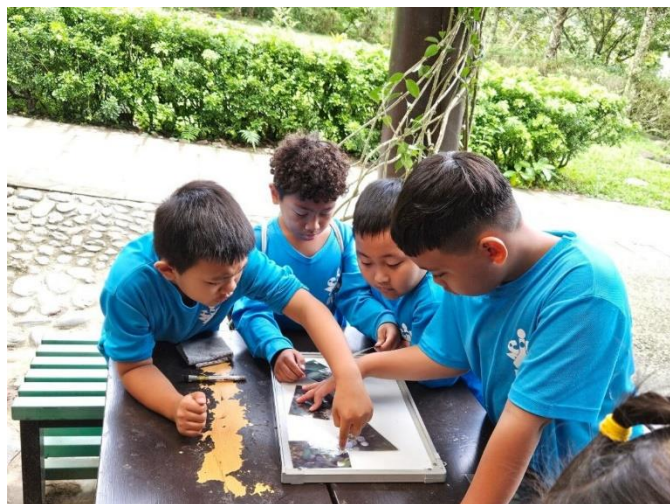
說明:植物拼圖操作