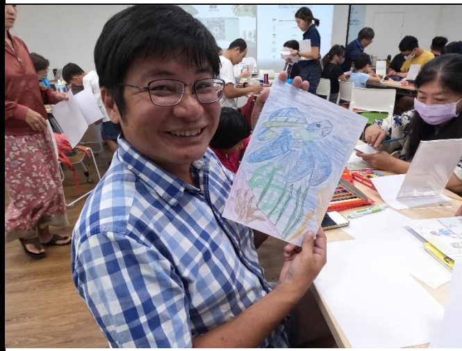
說明：學員創作作品