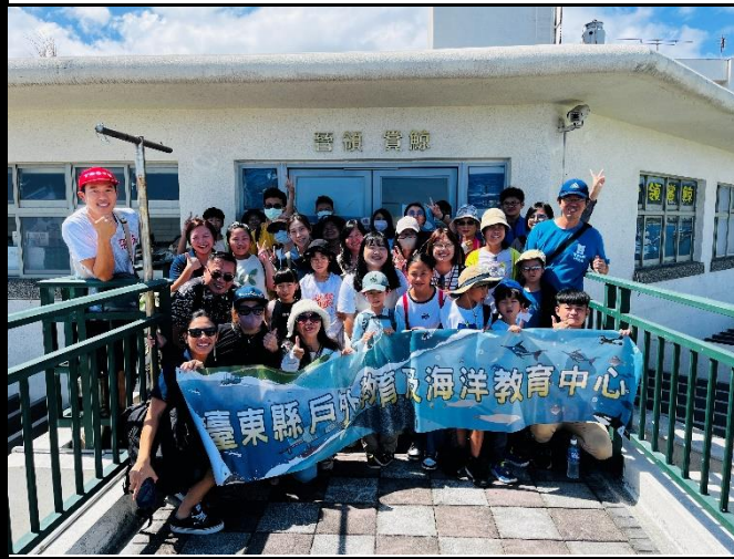
說明：晉領號候船室前大合照