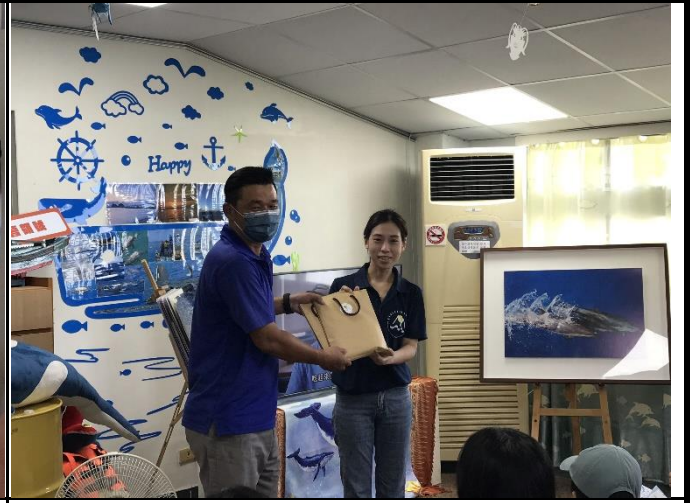
說明：由科長致贈禮品給船長