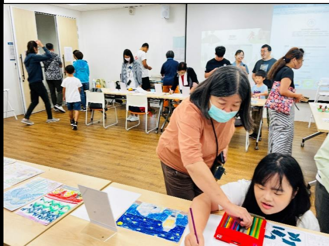
說明：進行成果展示