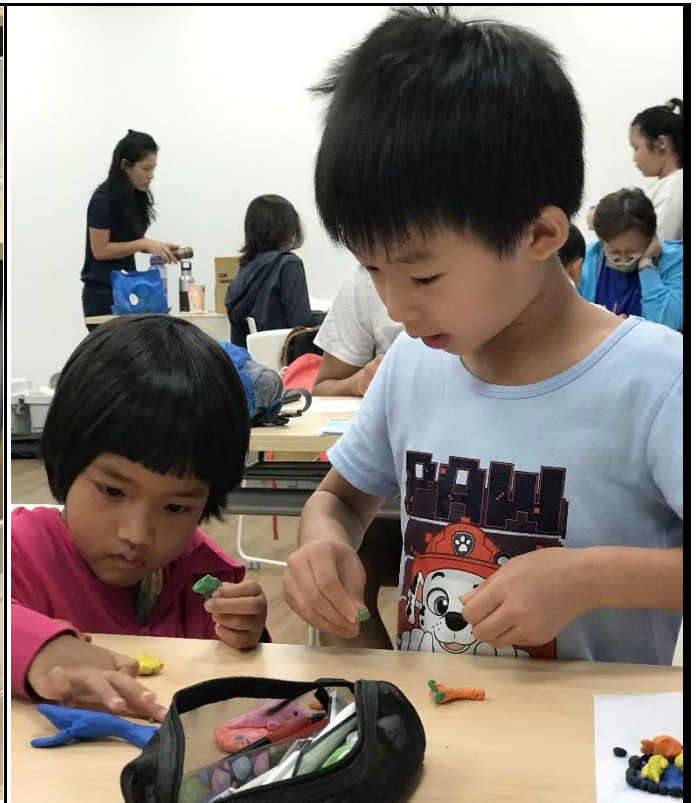
說明：學員進行創作