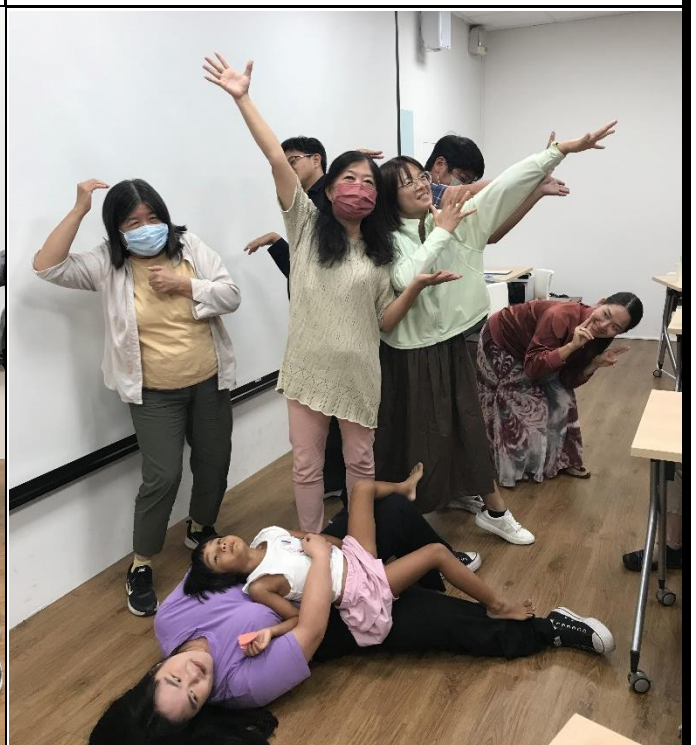
說明：繪本(圖版分鏡)創作練習