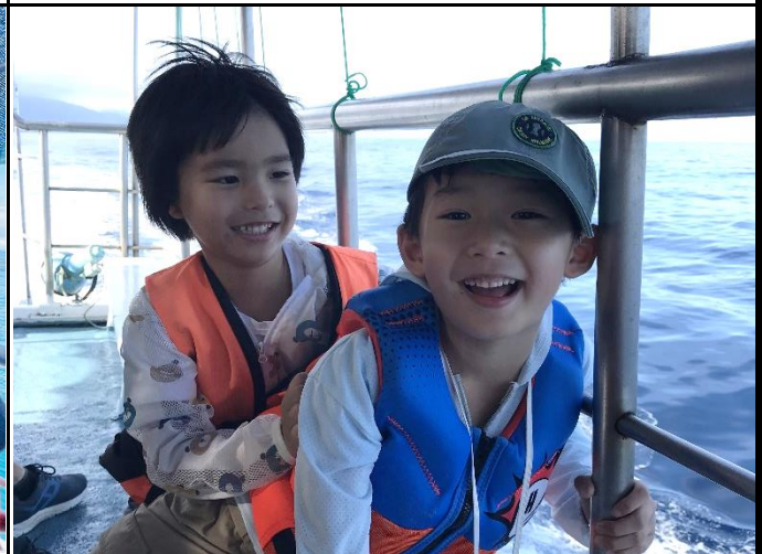
說明：學員享受航程