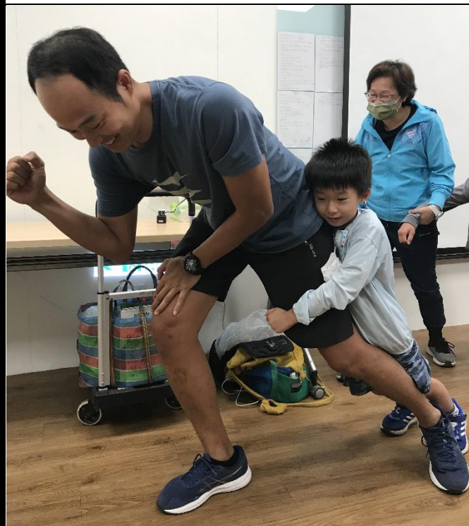
說明：繪本(圖版分鏡)創作練習