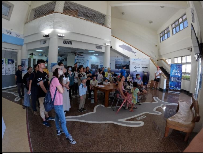
說明：在海環教室聆聽鯨豚導覽