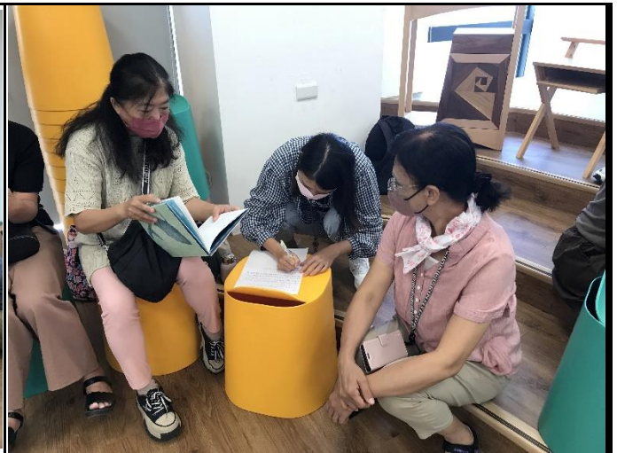
說明：繪本創作技巧-閱讀繪本並擷取個人直覺，互相分享及討論。