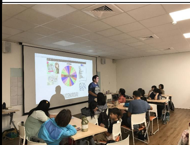
說明：繪本(文字)創作技巧