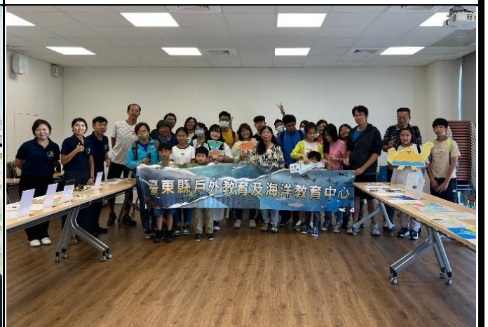
說明：學員成果展後大合照