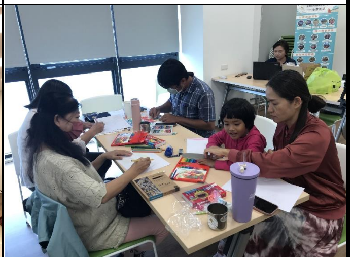
說明：學員開始創作