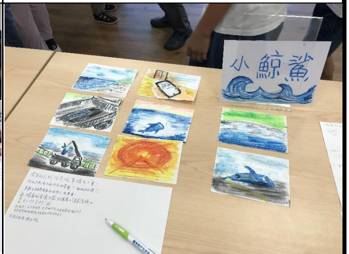
說明：學員創作作品展示