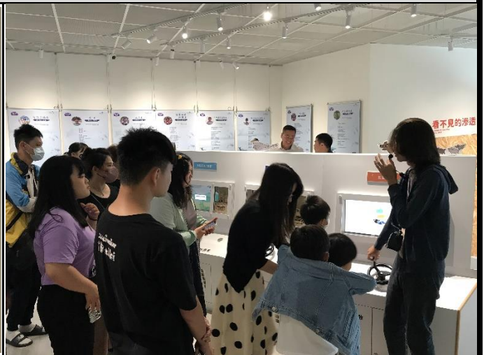
說明：永續方舟館導覽