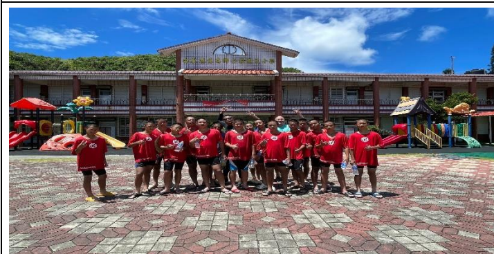
說明：與教練及公館國小合影。