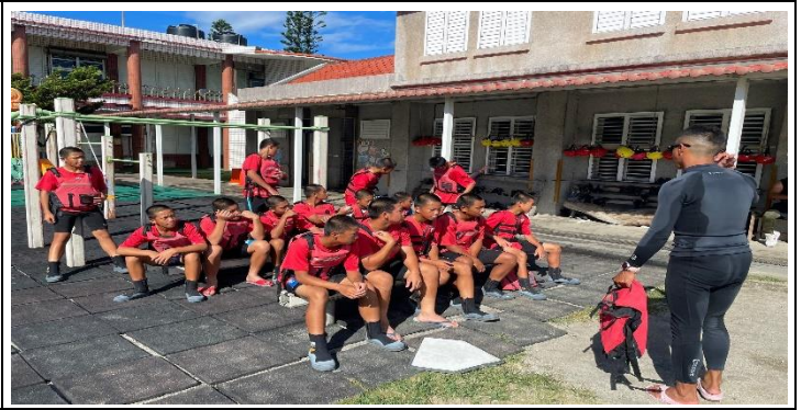
說明：獨木舟訓練，教練行前安全說明。