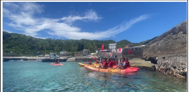
說明：獨木舟直線加速競賽。