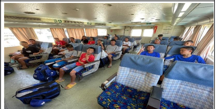
說明：依依不捨地離開綠島。