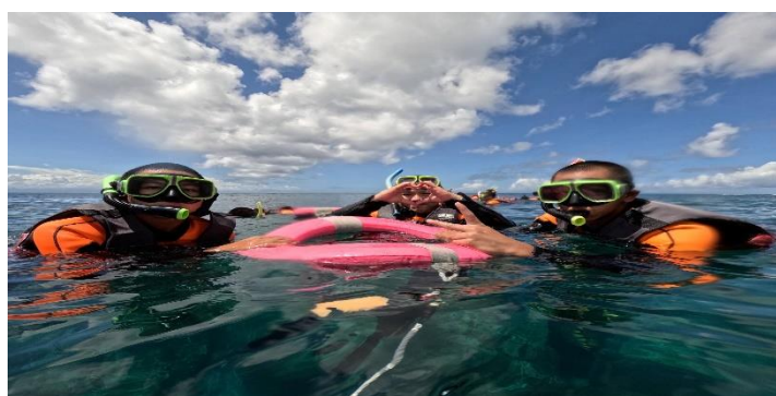
說明：柴口浮潛體驗