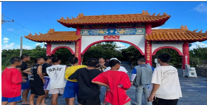
說明：了解觀音洞歷史