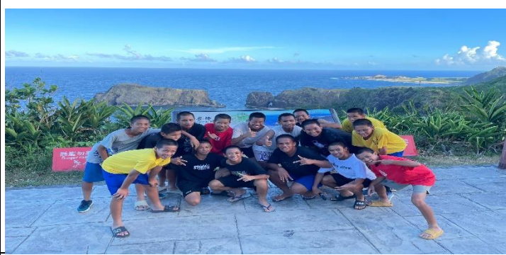
說明：海參坪看美人魚及哈巴狗