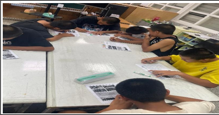
說明：無法去朝日溫泉，留在溫暖的公館國小圖書館利用手冊組間學習，加深對綠島的印象。