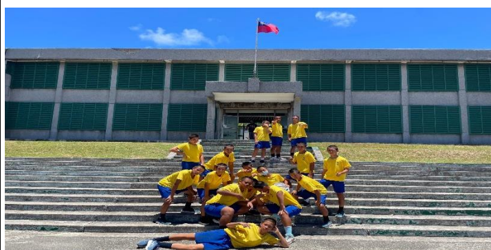
說明：下船直奔人權公園巡禮

照片/影片雲端網址： https://ttomec.boe.ttct.edu.tw/