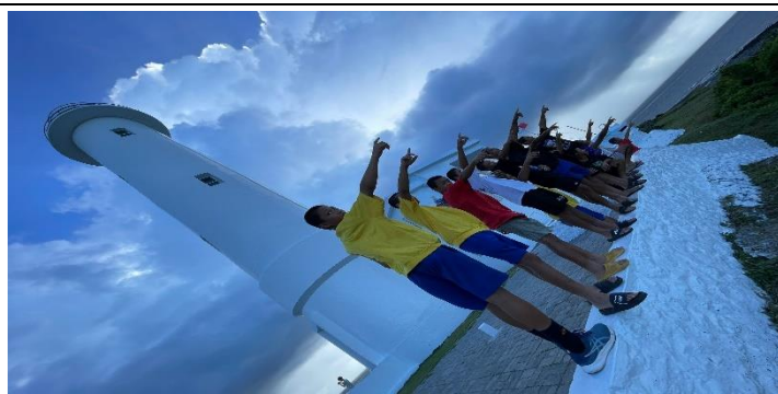
說明：登上綠島燈塔