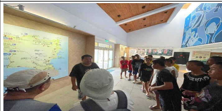
說明：綠島遊客中心環島解說