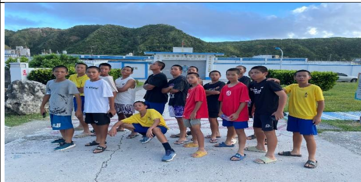
說明：綠島監獄前合影