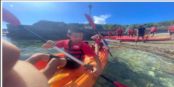
說明：下水操控獨木舟。