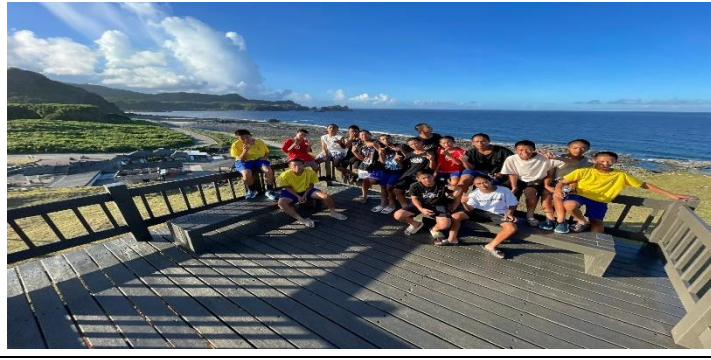
說明：因為變電箱爆炸休園無法體驗的朝日溫泉