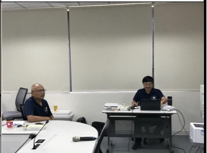
說明：會後討論及檢討