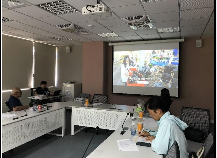
說明：觀看教師組參賽作品