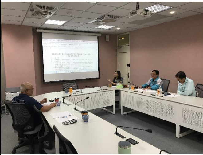
說明：評分標準討論及說明