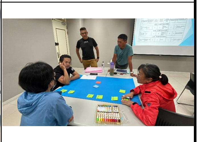
說明：討論情境可能發生風險狀況