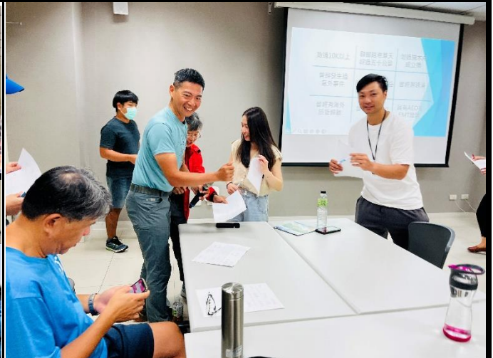
說明：破冰了解被解