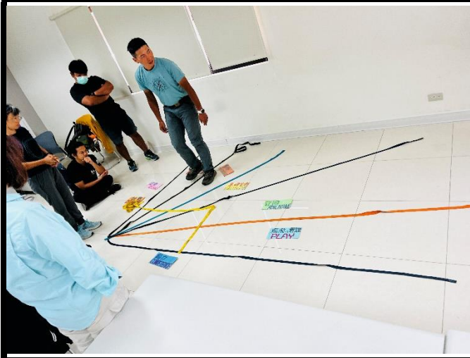
說明：了解風險承擔可能性