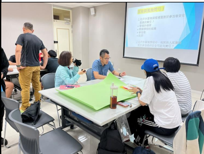
說明：情境課程規劃