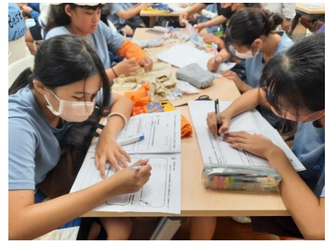
學生利用空檔時間完成學習手冊撰寫