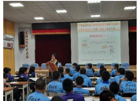
婦幼警察隊與少年隊的法治教育宣導