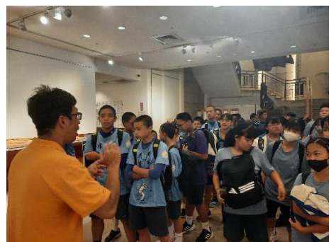
學生實作棉花糖活動&認識觀光場域安全設施