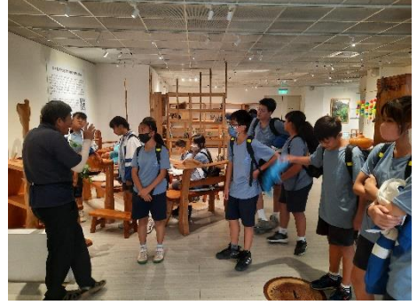
學生認識、體驗場館設施，聽取老師講解如何做到環境永續