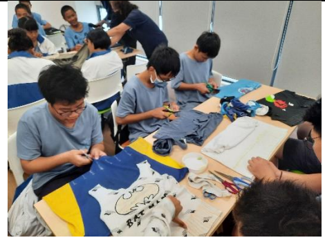
學生利用舊衣 DIY 製作環保提袋，並展示成果