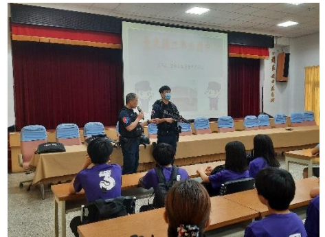
刑警大隊宣導及學生體驗警用槍械