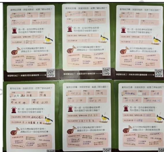
說明：野灣野生動物醫院學習單