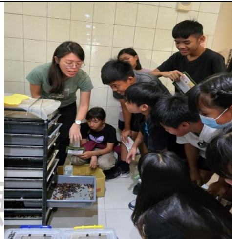
說明：動物食物製作與認識餌料動物