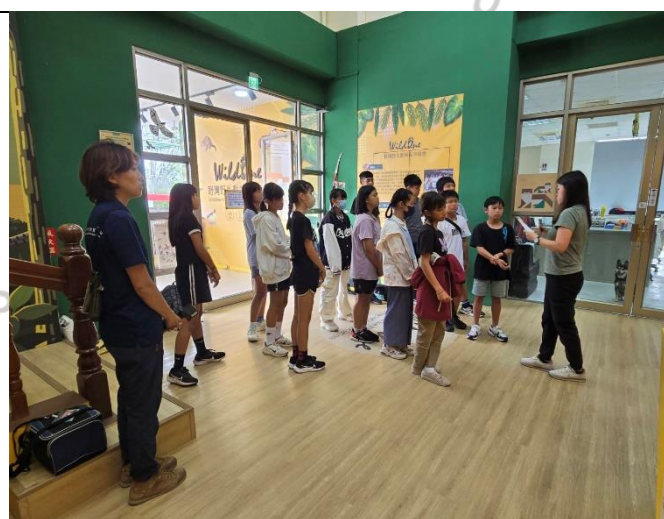
說明：導覽前介紹環境與注意事項