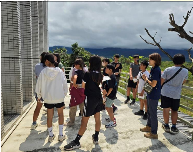
說明：了解窗殺/窗擊原因及預防方式