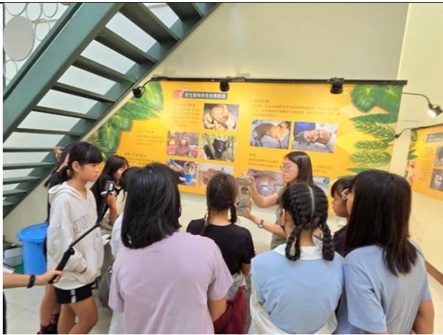
說明：了解野生動物進入醫院的生命故事