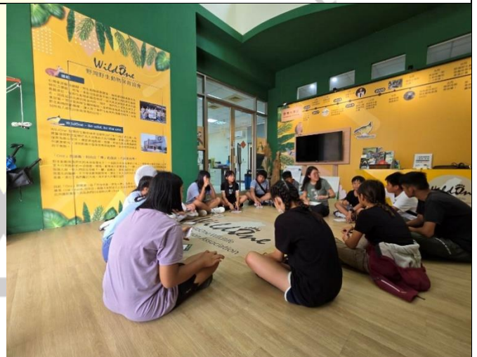
說明：課程統整時的問答與分享