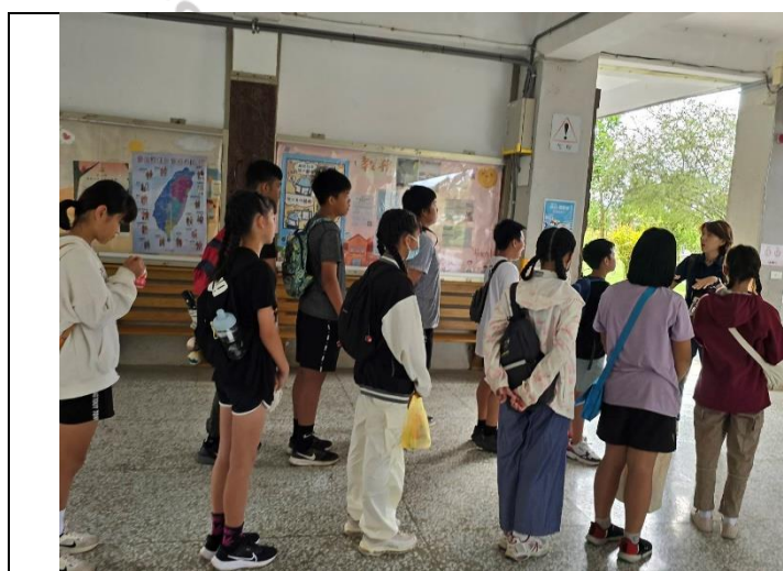
說明：行前說明動物醫院須注意事項與原因