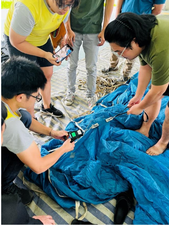
說明:熱氣球拉力測試