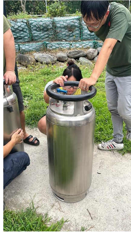
說明:檢查丙烷燃料瓶