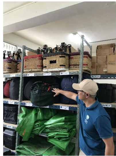
說明:7 公尺小球，球體及球籃

其他照片： https://photos.app.goo.gl/umsLdUR2aYf85RdYA