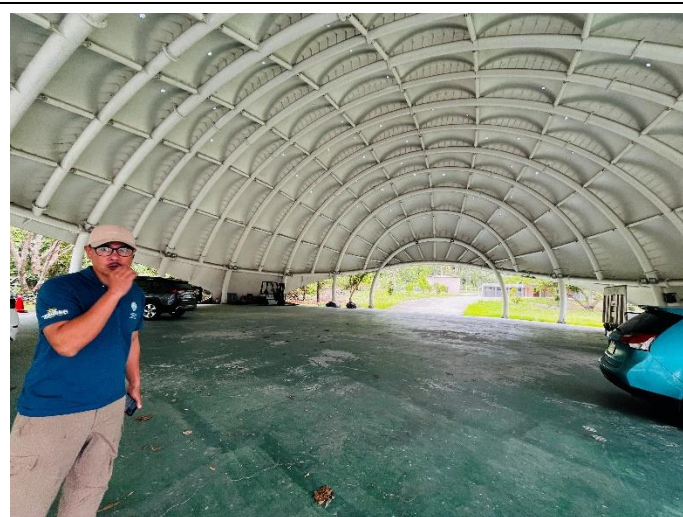
說明：熱氣球室內場，做檢修、測試用