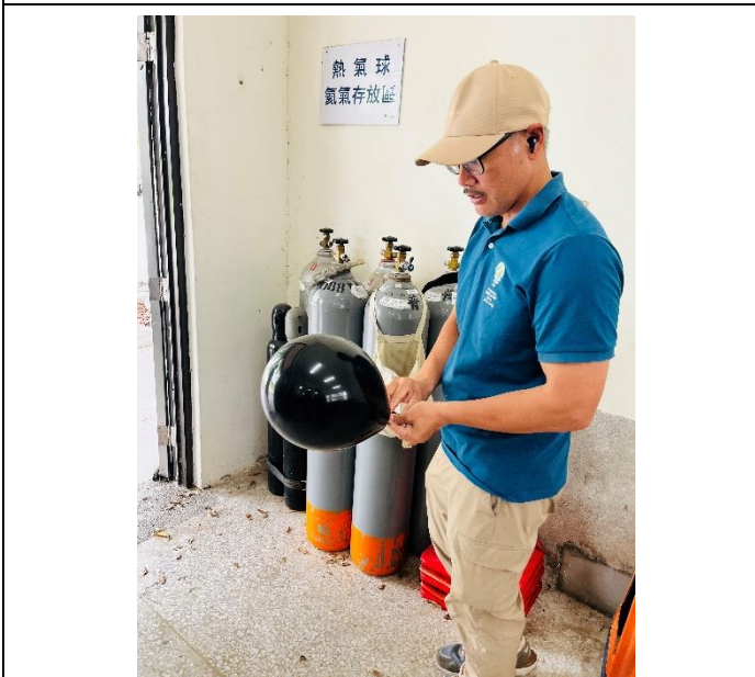
說明：分行前施放氬氣球觀察風向