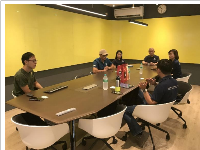
說明：討論課程發展