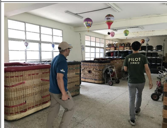
說明：熱氣球存放倉庫