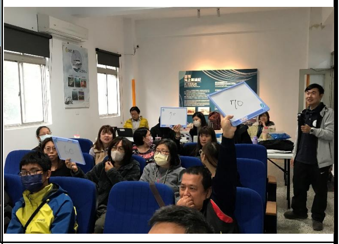
說明：漁業大亨情境遊戲競標魚貨過程