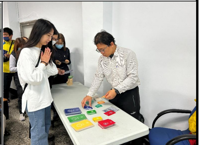
說明：遊戲中的交易所