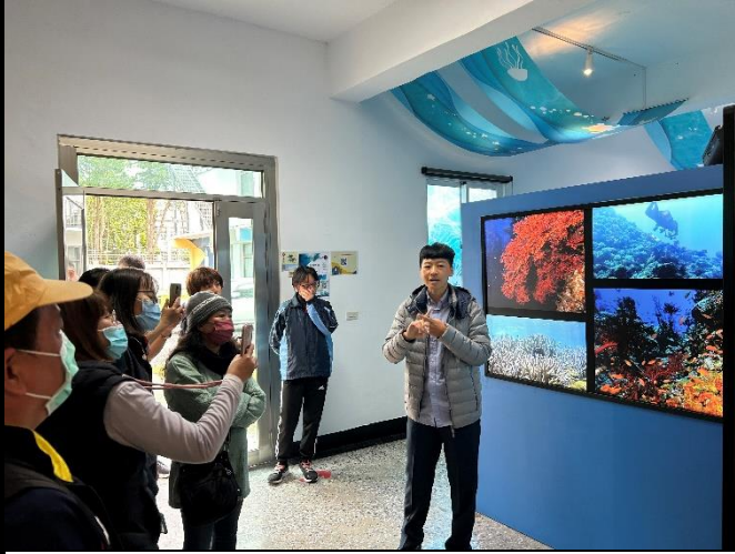
說明：海洋驛站導覽