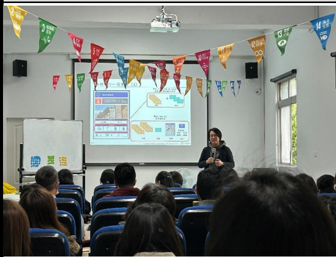
說明：講師進行 SDGs GAME 遊戲說明