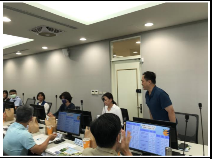
說明：各單位代表進行回饋及交流