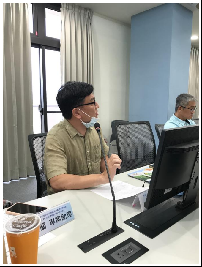
說明：各單位自我介紹