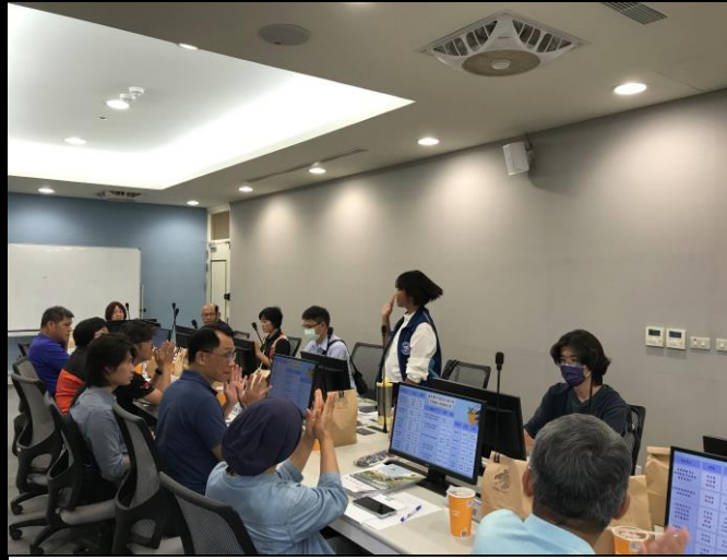
說明：各單位代表進行回饋及交流