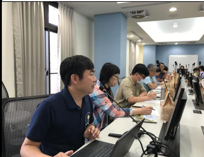
說明：中心執秘報告內容