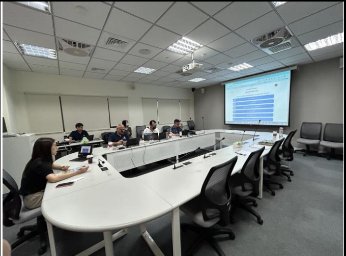
說明：各項計畫總表