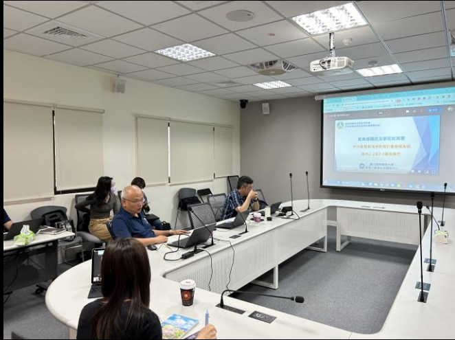
說明：教育處課發科科長開場