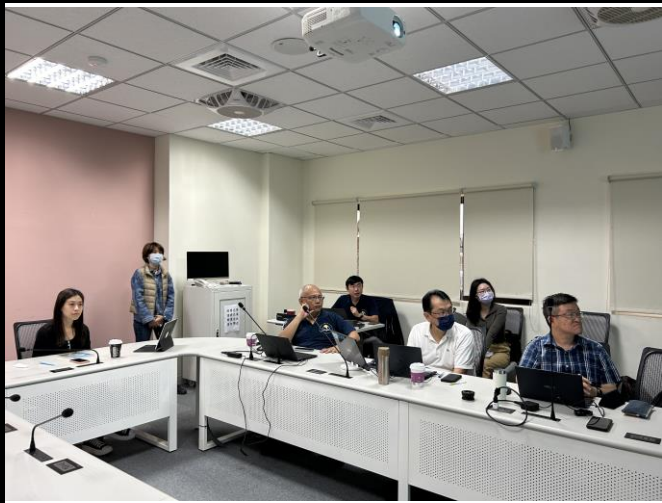
說明：審查系統使用說明