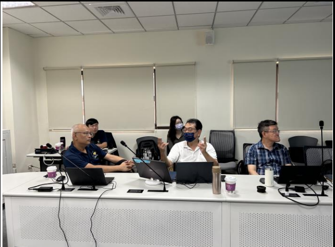
說明：計畫審查討論