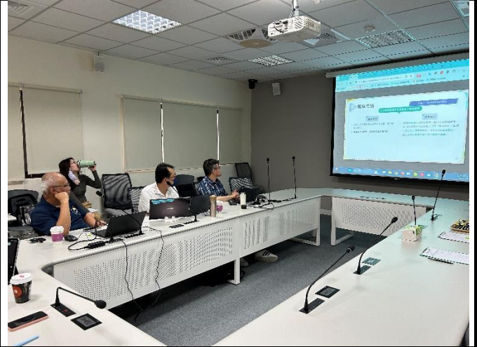
說明：說明計畫撰寫重點