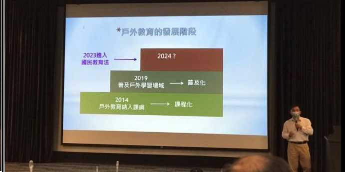
說明：進行補助說明會