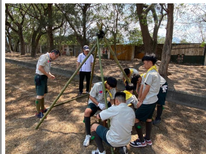
照片說明：實作-餐桌與流理台製作。