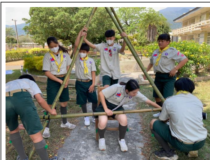
照片說明：實作-餐桌與流理台製作。