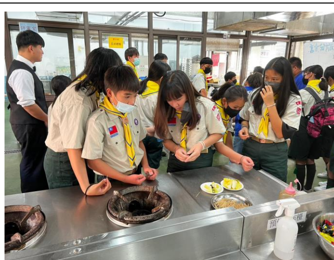
照片說明：112/3/10 三五童軍節慶祝大會。 (成功商水)(10 人)