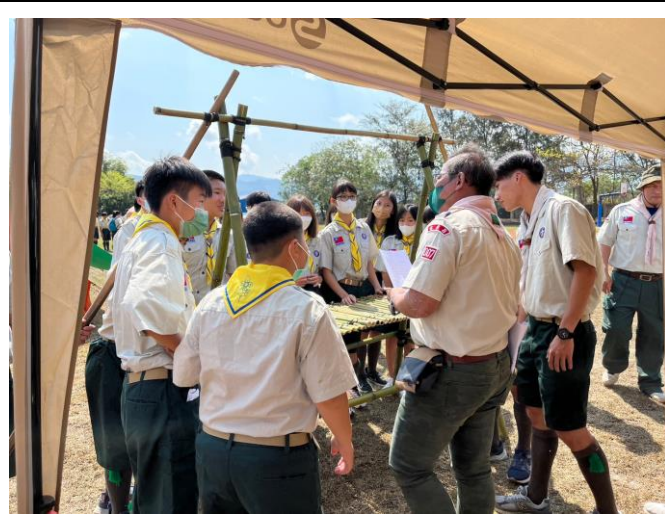
照片說明：講師解說繩結與竹材之運用。