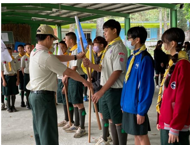
照片說明：112/4/7-9 童軍工程考驗營。 (18 人，嘉豐營區)