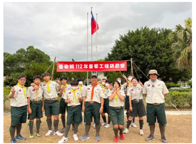
照片說明：瑞源國中童軍小隊合照。