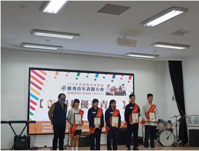
照片說明：112/3/22 優秀青年表揚大會。(1 人)