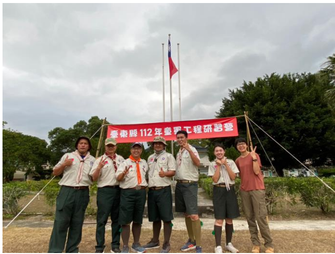
照片說明：講師及服務員合照。