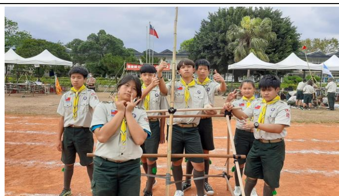
照片說明：實作-羅馬砲製作。