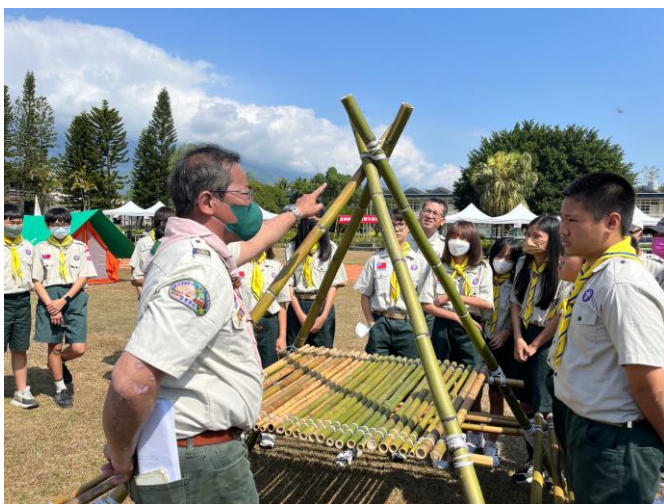
照片說明：講師解說繩結與竹材之運用。