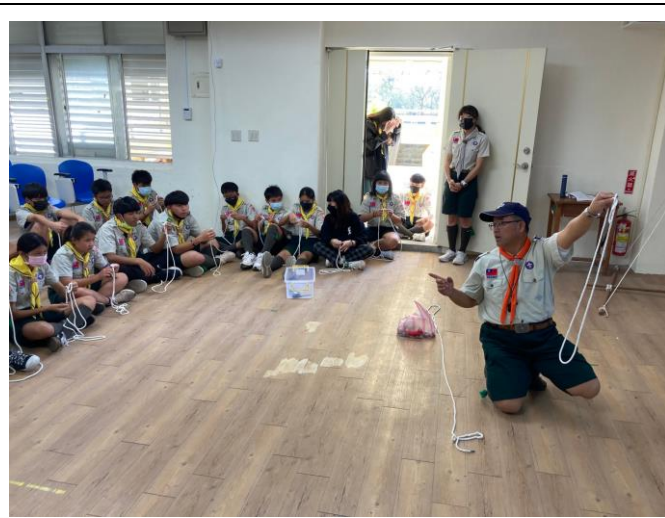
照片說明：112/2/22 童軍團集會-初級繩結。