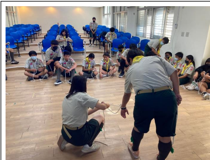
照片說明：112/2/22 童軍團集會-初級繩結。