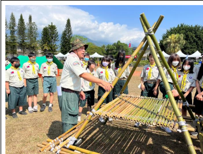
照片說明：講師解說繩結與竹材之運用。