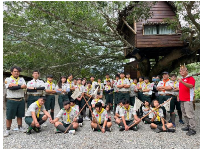
照片說明：112/1/18-19 學生多元試探學習活動暨童軍活動。(卡米莎度露營區)