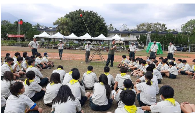
照片說明：實作-羅馬砲製作。