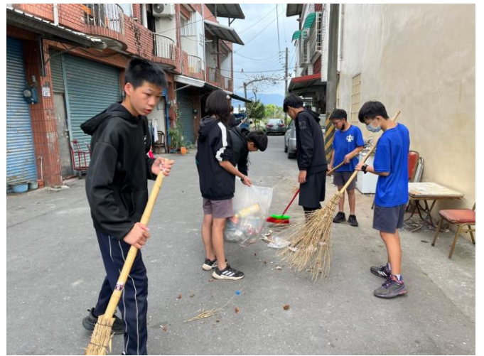
照片說明：112/2/18 服務學習-瑞和社區打掃。