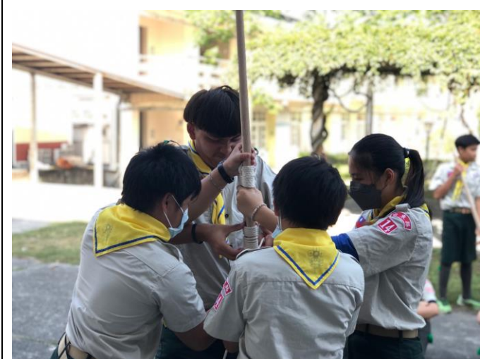
照片說明：112/3/22 童軍團集會-工程基本繩結