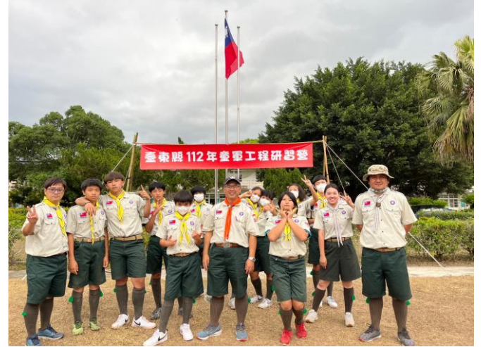
照片說明：112/3/25 童軍工程研習營。(19 人)