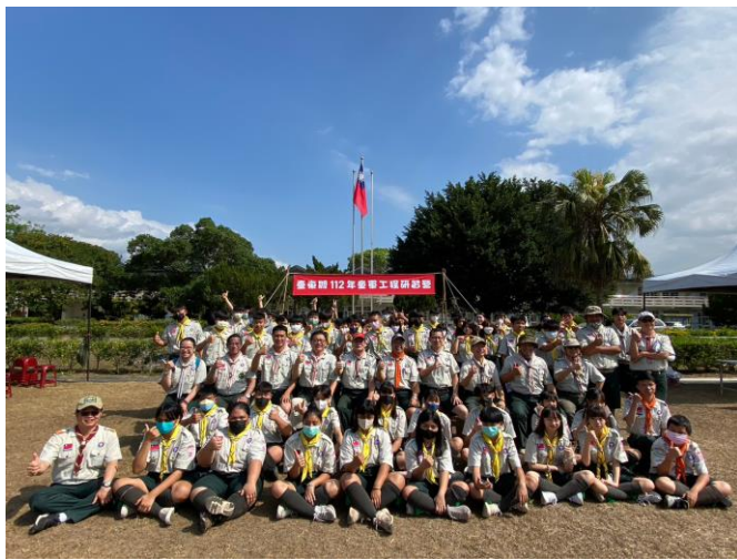
照片說明：團體大合照。