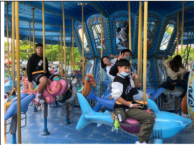
照片說明：112/6/2 兒童新樂園