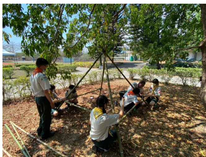
照片說明：實作-餐桌與流理台製作。