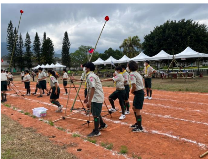
照片說明：羅馬砲投擲競賽。