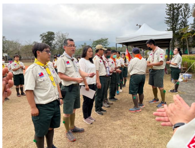
照片說明：閉幕典禮-頒獎。