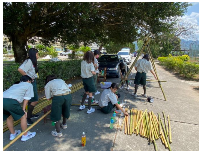
照片說明：實作-餐桌與流理台製作。