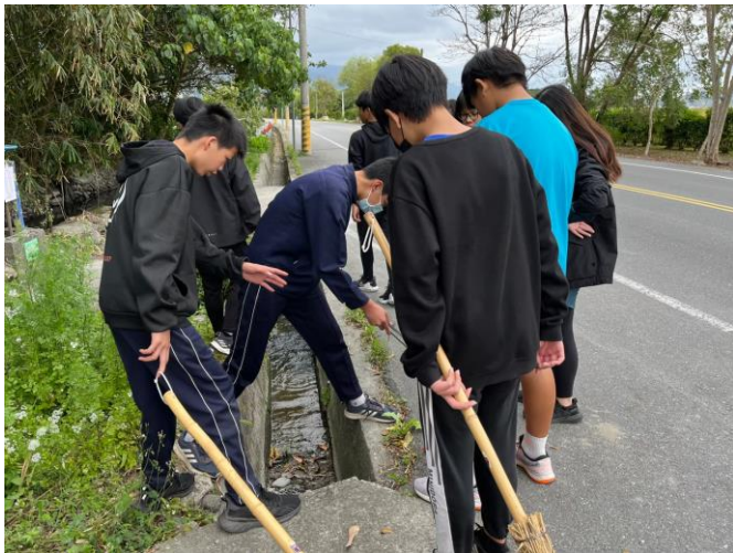
照片說明：112/2/18 服務學習-瑞和社區打掃。