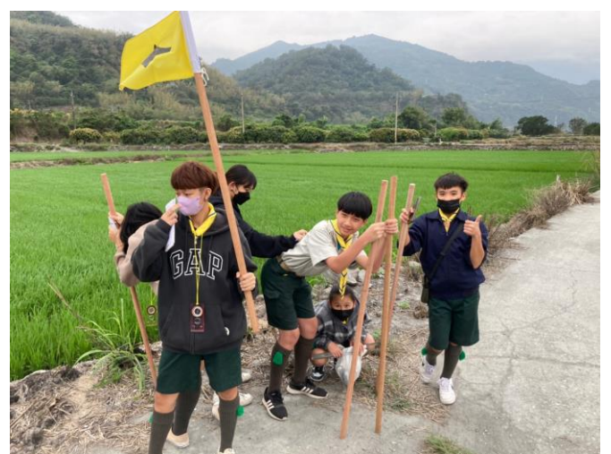
照片說明：112/4/7-9 童軍工程考驗營。 (18 人，嘉豐營區)