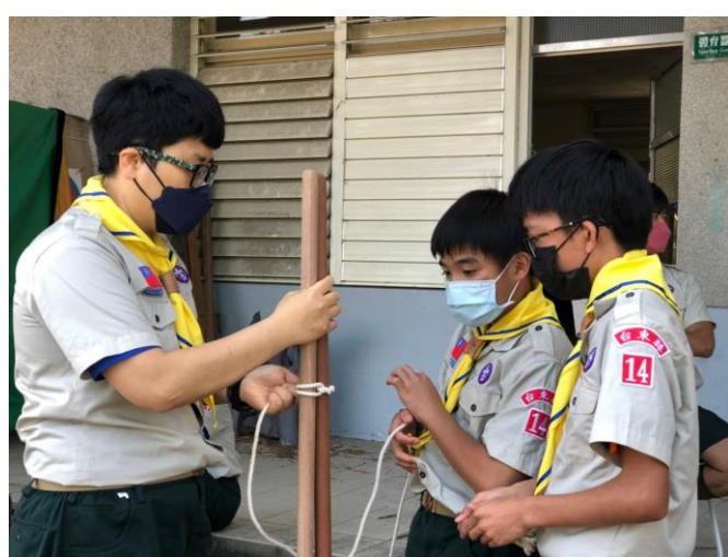
照片說明：112/3/22 童軍團集會-工程基本繩結