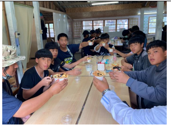
照片說明：112/6/3 宜農牧場

自行車推廣教育課程 112/06/28(瑞源-鹿野)112/06/29(瑞源-安通)