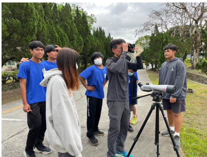
照片說明：112/3/29 賞鳥活動。(賞鳥協會講師)