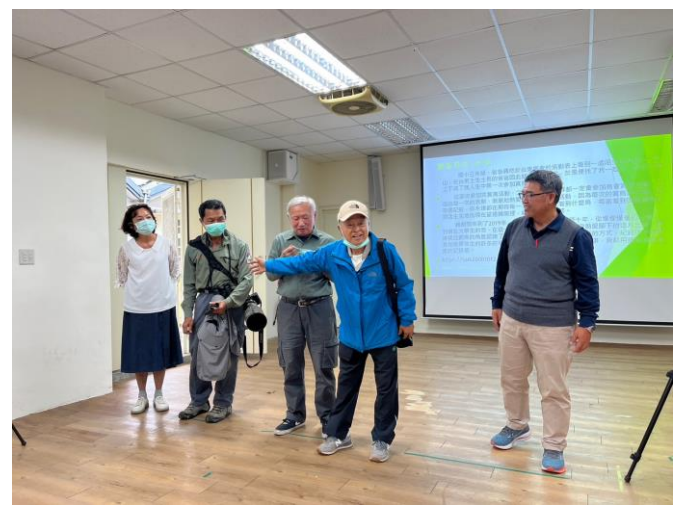
照片說明：112/3/29 賞鳥活動。(賞鳥協會講師)