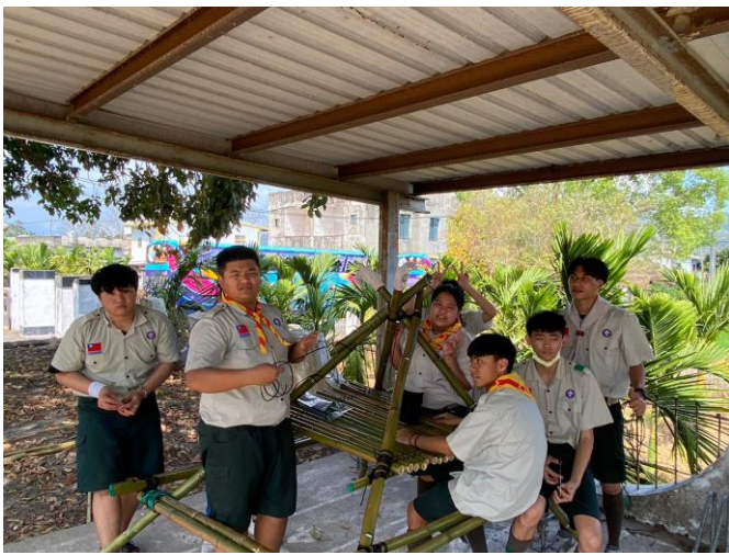
照片說明：實作-餐桌與流理台製作。