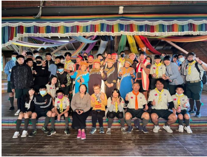
照片說明：112/1/18-19 學生多元試探學習活動暨童軍活動。(布農部落)