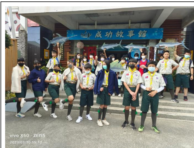
照片說明：112/3/10 三五童軍節慶祝大會。 (成功商水)(10 人)