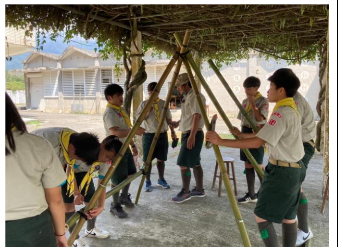
照片說明：講師解說繩結與竹材之運用。