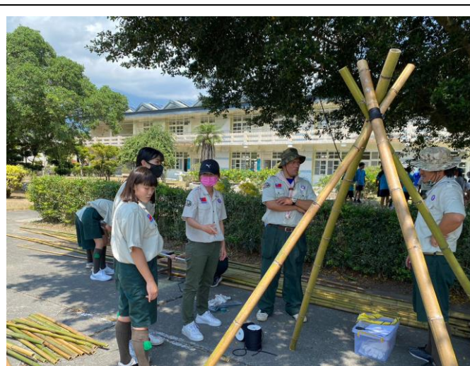
照片說明：實作-餐桌與流理台製作。