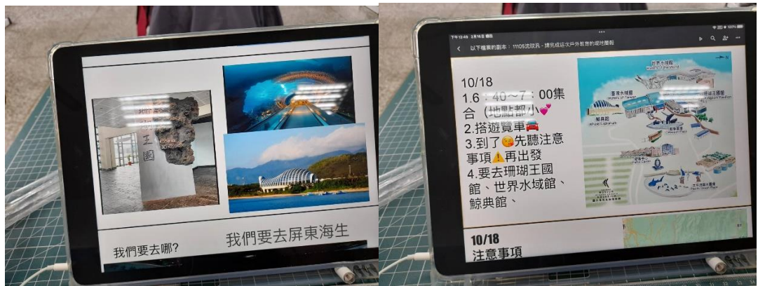
行前分組製作簡報