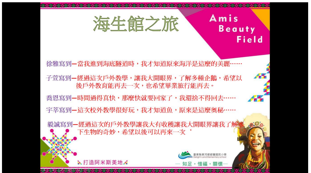
課程實施後學生以文字分享學習心得