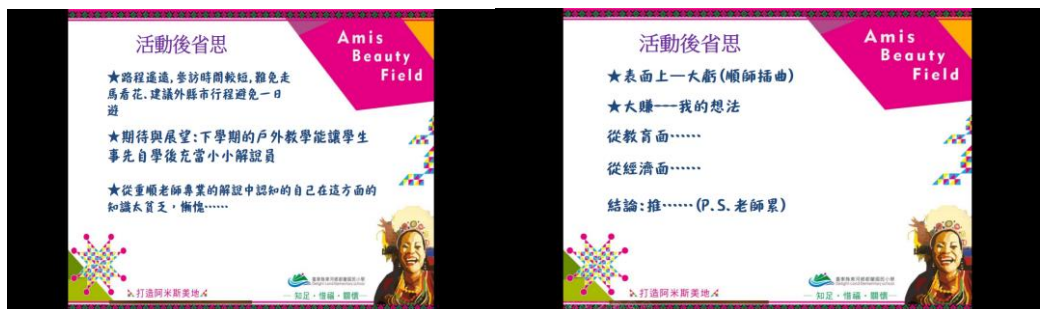
校內分享成果與檢討省思時，因不同角度思考而產生新的意見交流與溝通。